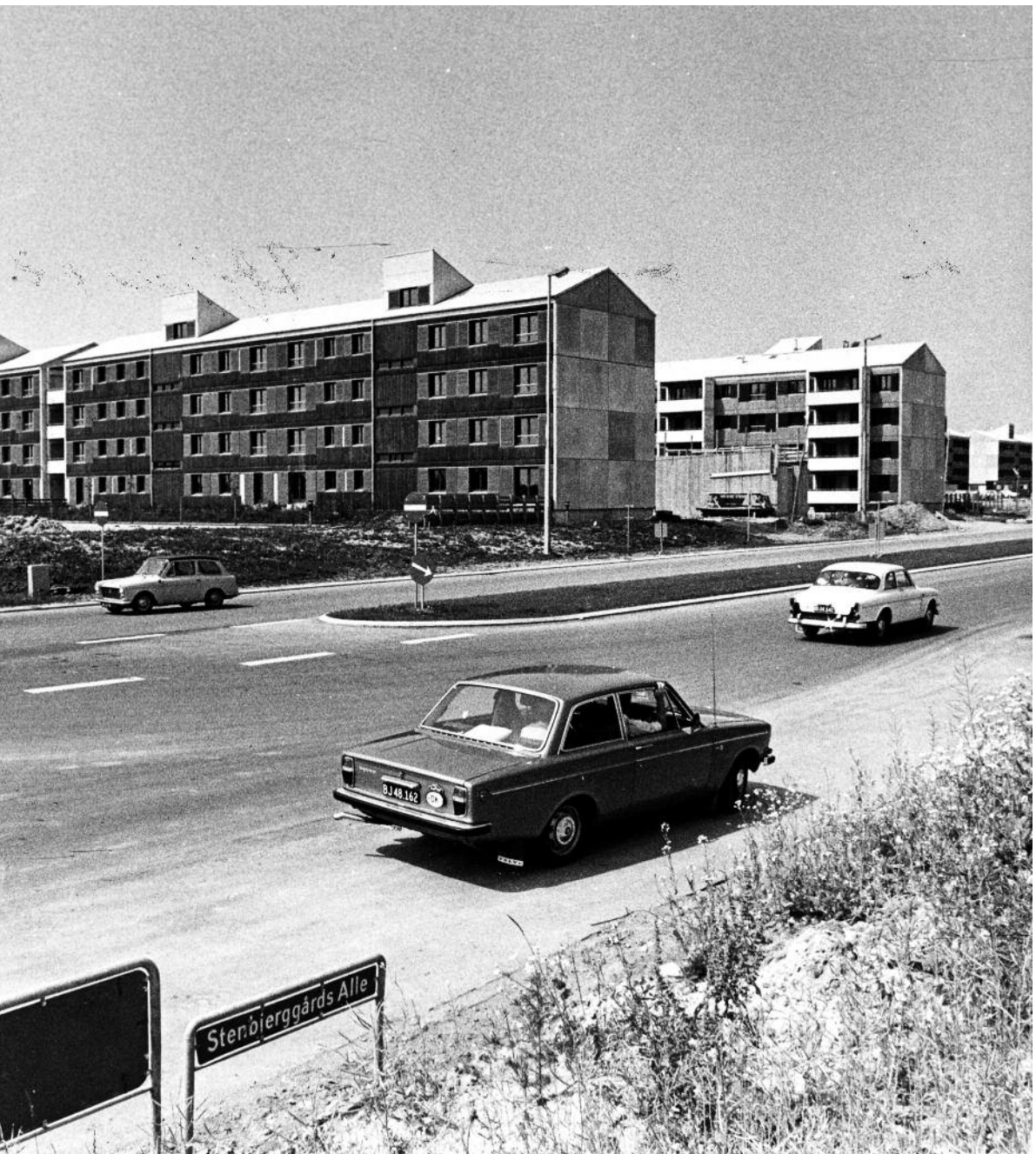
Ishøjplanen, i dag Vejleåparken, som nybyggeri i begyndelsen af 1970'erne.