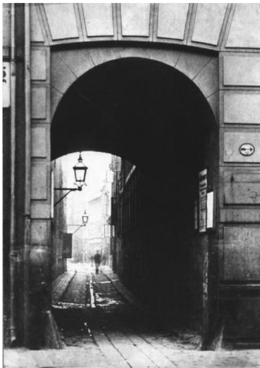
Indgangen til Peder Madsens Gang fra Østergade ca. 1870.

til lejligheden Det Københavnske Byggeselskab og fik entreprisen med saneringen, der gik i gang i 1873. Tre år senere var sporene af gaden næsten borte, og i dag minder kun det lille Pistolstræde, om end stærkt ombygget og kommercialiseret, os om det, der var engang. I 1800-tallets København fandtes ikke høringsrunder for berørte borgere eller harske avisskriverier om fjernelsen af kulturmiljøer, nærmere tværtimod. Gaden var en torn i øjet på mange københavnere, hvilket bl.a. kom til udtryk i myndighedernes handlinger og kunne læses i den liberale presse. Her er det en skribent fra Fædrelandet, som ytrer sin mening i avisens spalter: "Ligesom der er dyr, hvis instinkt anviser dem dynd, møddinger, ådsler og anden uhumskehed til opholdssted, således er der jo aldeles ingen tvivl om, at der er menne-