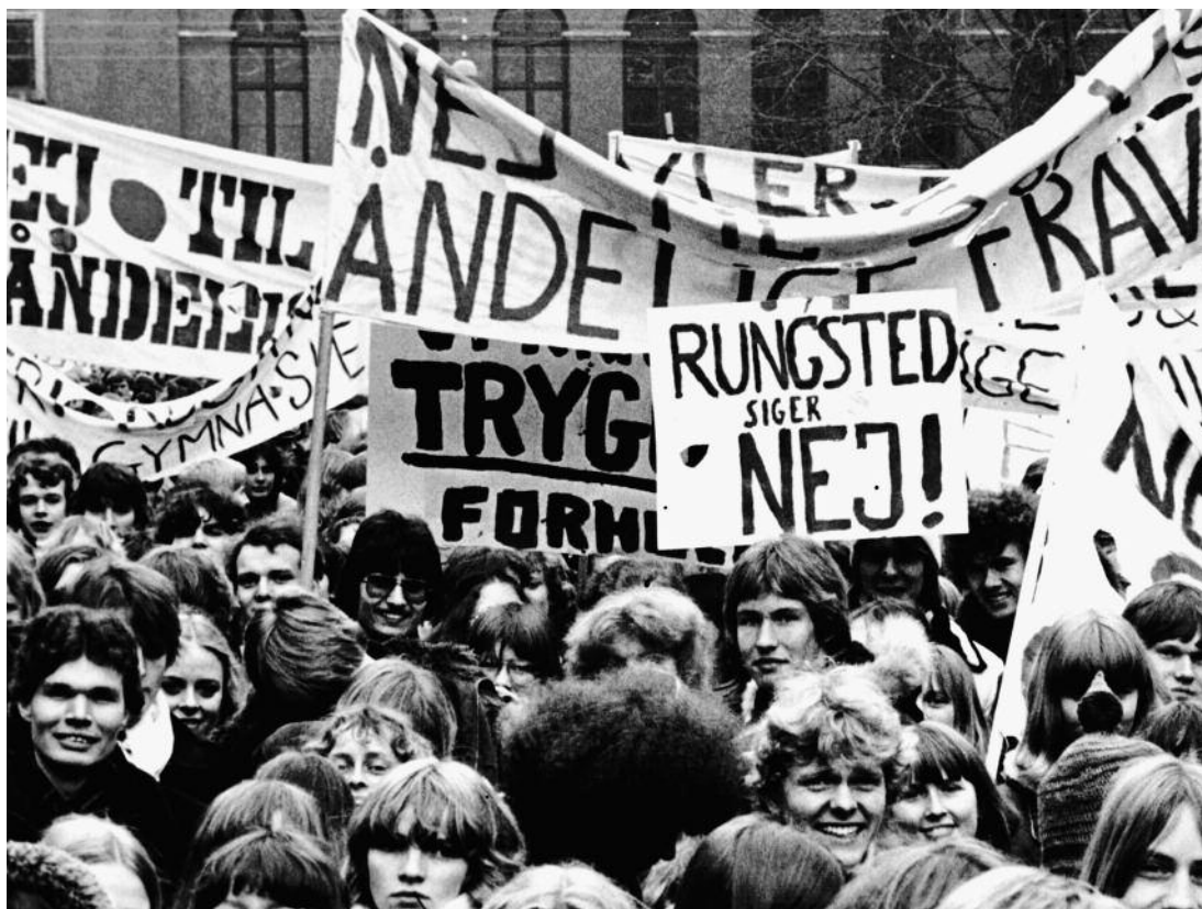
Gymnasieelever demonstrerer mod fraværscirkulæret i 1979. Skole- og gymnasieelever og andre uddannelsessøgende, formåede i årene 1973-84, med en genoplussen i begyndelsen af årtusindskiftet, at samle i titusindvis i protest mod de sidende regeringers undervisningsreformer og nedskæringspolitik.

toire og dermed befolkningens deltagelse i den demokratiske proces. En proces, som flere unge fra 1978 kunne deltage i som helt almindelige vælgere, da valgretsaldern, som følge af tidens venstredrejning og ændrede holdning til 'ungdommen', nu blev sænket, så den matchede myndighedsaldern, dvs. til de nuværende 18 år. 62