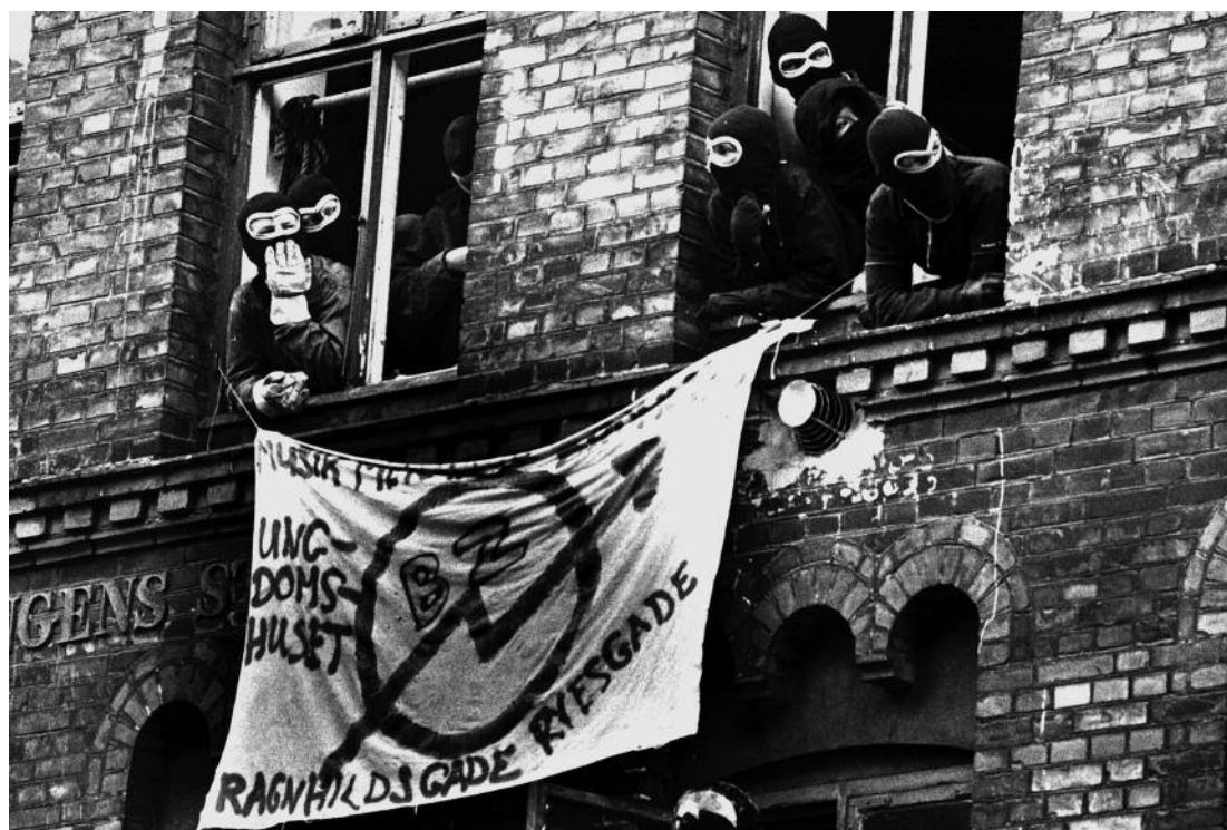
I efteråret 1981 blev Initiativ'-gruppen for et Ungdomshus dannet. I foråret 1982 udviklede dele af gruppen sig til BZ-brigaden. En husbesætterbevægelse i lighed med samtidige bevægelser i resten af Europa.

– ikke mindst kvinderne – var religion, og det vil overvejende sige islam (ligheden med ungdomsoprørets socialistiske ideologi er her slående). Fra midten af 1980'erne og fremefter oprettedes adskillige muslimske ungdomsorganisationer, hvoraf flere kan nævnes: Muslim Youth League (etableret 1986), Foreningen af Studerende Muslimer (FASM 1988), Organisationen for Pakistanske Studerende og Akademikere (OPSA 1993), Hizb ut-Tahrir (1994), Muslimsk Ungdom i Danmark (MUNIDA 1995), Danmarks Forenede Cybermuslimer (DFC 1998), The Network (2001) og Muslimer i Dialog (2003). Disse og andre muslimske ungdomsorganisationer – heriblandt et stort antal uformelle religiøse studiegrupper – er med til at cementere billedet af en islamisk ungdom i bevægelse. Flere af dem har rod i studentermiljøet, og der er ikke tvivl