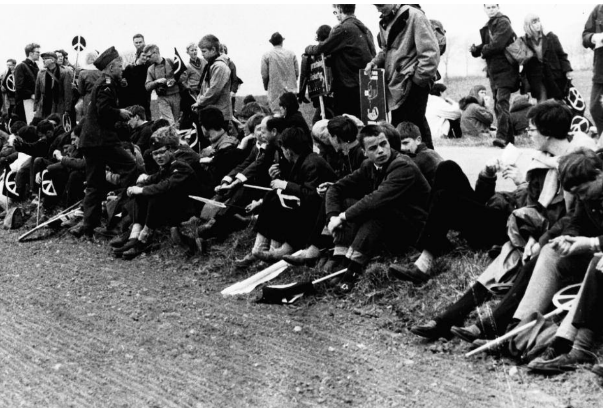
Deltagere i atommarchen fra Holbæk til København i 1962. Den Kolde Krig skabte interne spændinger i den danske befolkning. Især optrapningen af det atomare våbenkapløb mellem Øst og Vest mobiliserede i tusindvis af unge mennesker, der fandt sammen i Kampagnen mod Atomvåben.

pagten, samledes på Amalienborg Slotsplads, hvor de sang "Ja, vi elsker dette landet" og udbragte et leve for kongen. 39 Demonstrationen var helt klart en politisk kritik af regeringens samarbejdslinje båret frem af konservative studentermiljøer anført af en gruppe regensianere med ståsted i Dansk Samling. 40 Studenternes opråb blev duplikeret i titusindvis og spredt over landet. Mange af de implicerede studenter gik senere ind i illegalt arbejde.