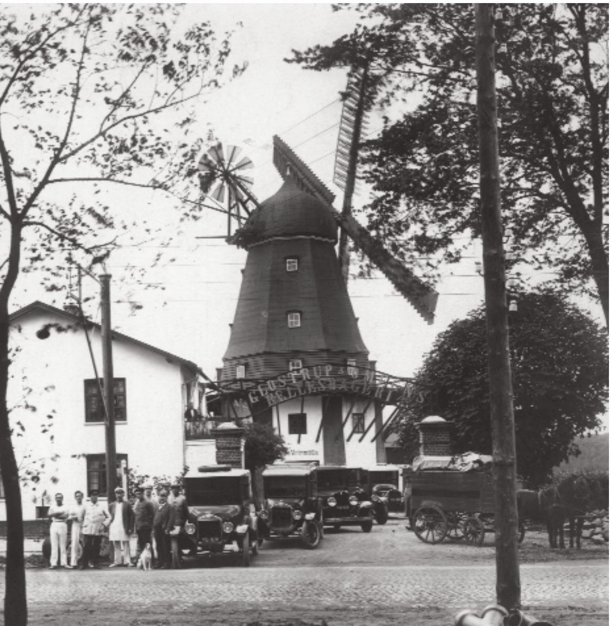
Ansatte og køretøjer på fællesbageriet Røde Vejmølle opstillet ud til Roskildevejen i 1920'erne.