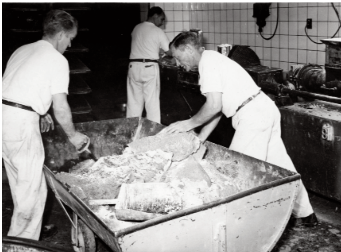
To bagere håndterer dejen til rugbrød. Arbejdernes Fællesbageri på Nørrebro i 1950'erne.

og Glostrup. Salget af småkager, der hovedsageligt gik til eksport, steg hurtigt. 57 I 1990 kunne Dansk Biscuit Compagni opkøbe sin største danske konkurrent og var derefter landets klart største producent af småkager. 58