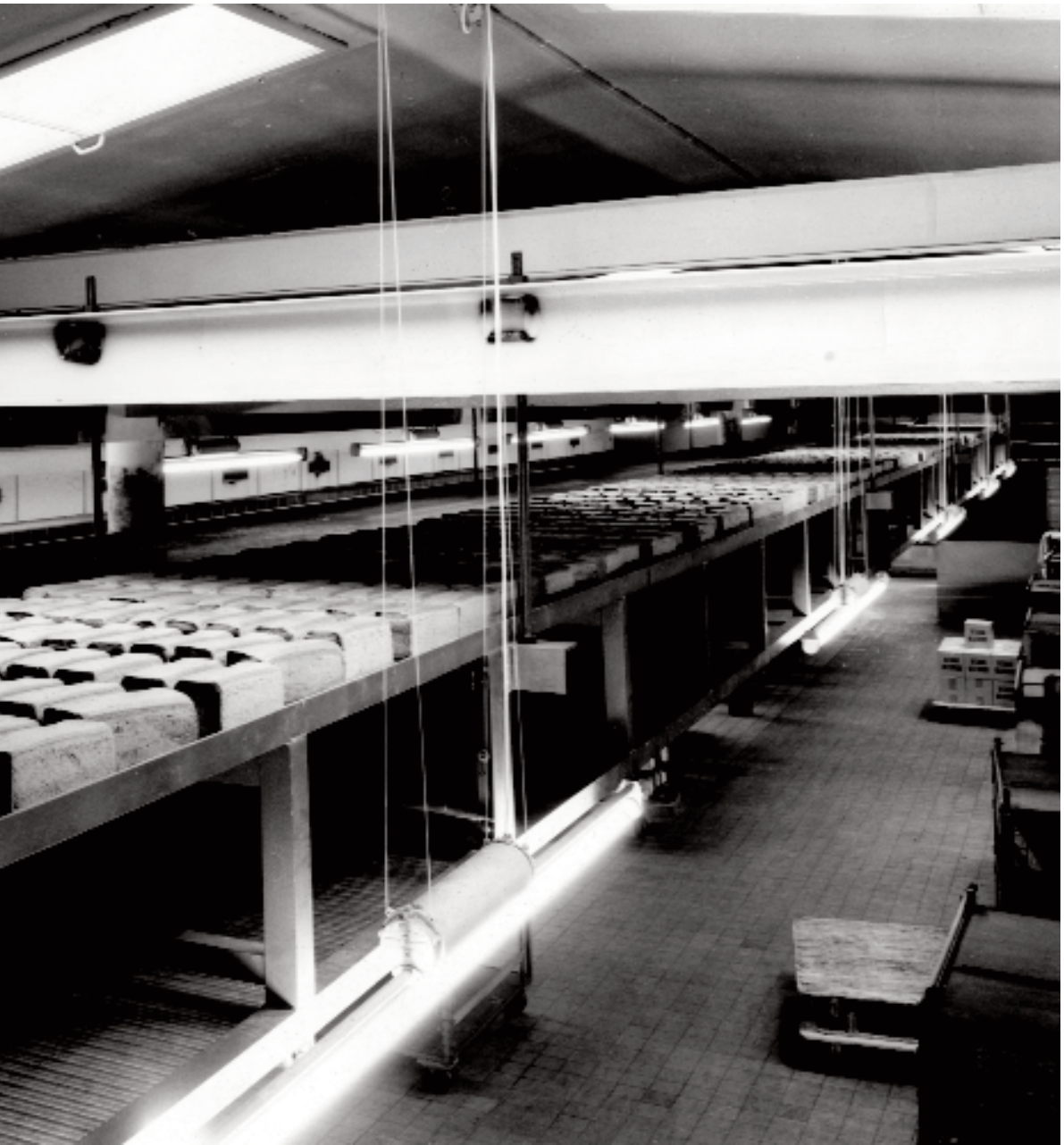
De færdige rugbrød transporteres automatisk fra ovnen i Arbejdernes Fællesbageri på Nørrebro. Rugbrødsfremstillingen blev automatiseret i 1960'erne.