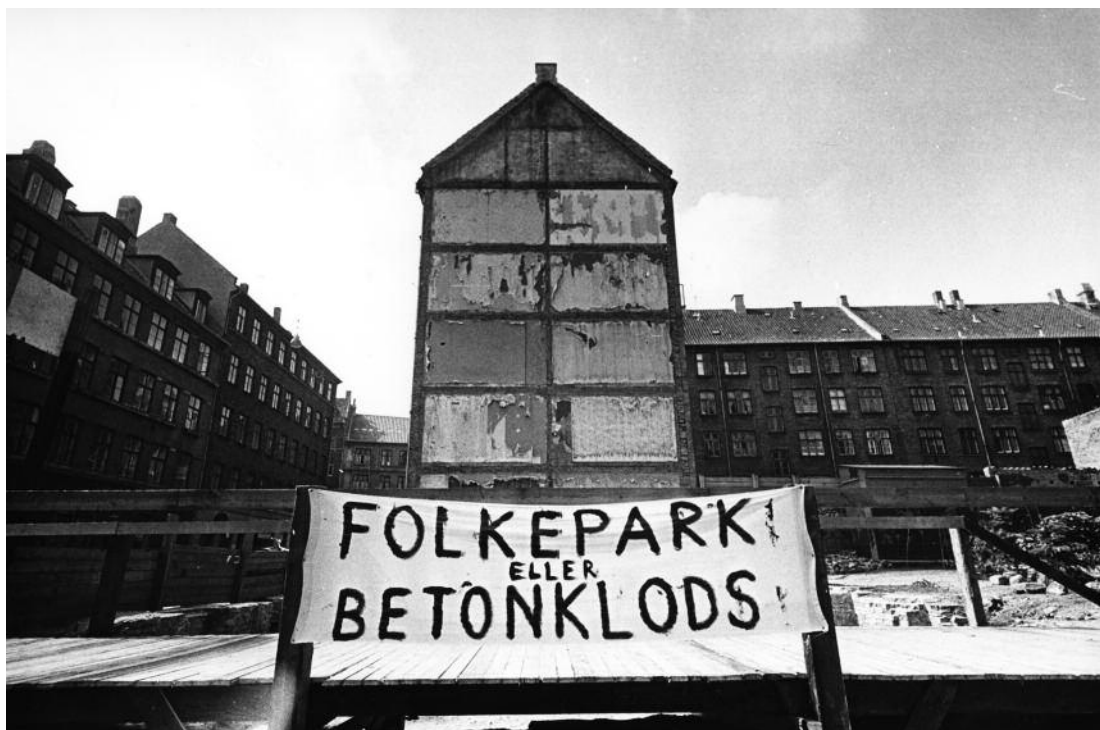
Folkepark eller betonklods- det blev en folkepark. Danske slumstormere i aktion i Stengade på Nørrebro i 1971. Fotograf Ernst Nielsen. Foto: Arbejdermuseet & ABA.

lieues), hvor de første opstande fandt sted, var lidet iøjnefaldende steder, der lå langt borte fra “spektaklets samfund” (den del af samfundet, hvor tingene typisk sker, o.a.). I denne sammenhæng dementerer Seidman – selvom det her sker under den meget upassende overskrift Sex, Drugs and Revolution – også forestillingen om et tidsmæssigt-rumligt defineret udgangspunkt for “majdagene i Paris”: “ Nanterre enragés are often seen as creating the movement, but an equally logical starting point might be Antony, where students protested against dormitory restrictions as early as 1963”. 12 I Antony, en forstad syd for Paris, blev der mellem 1955 og 1957 bygget otte kollegier, der var op til 11 etager høje og som i 1967 var bolig for 1523 enlige mænd, 310 enlige kvinder og 488 gifte par. 13 Næsten en fjerdedel af disse mennesker, der dagligt pendlede til Paris for at studere eller arbejde, havde en baggrund som emigranter. De