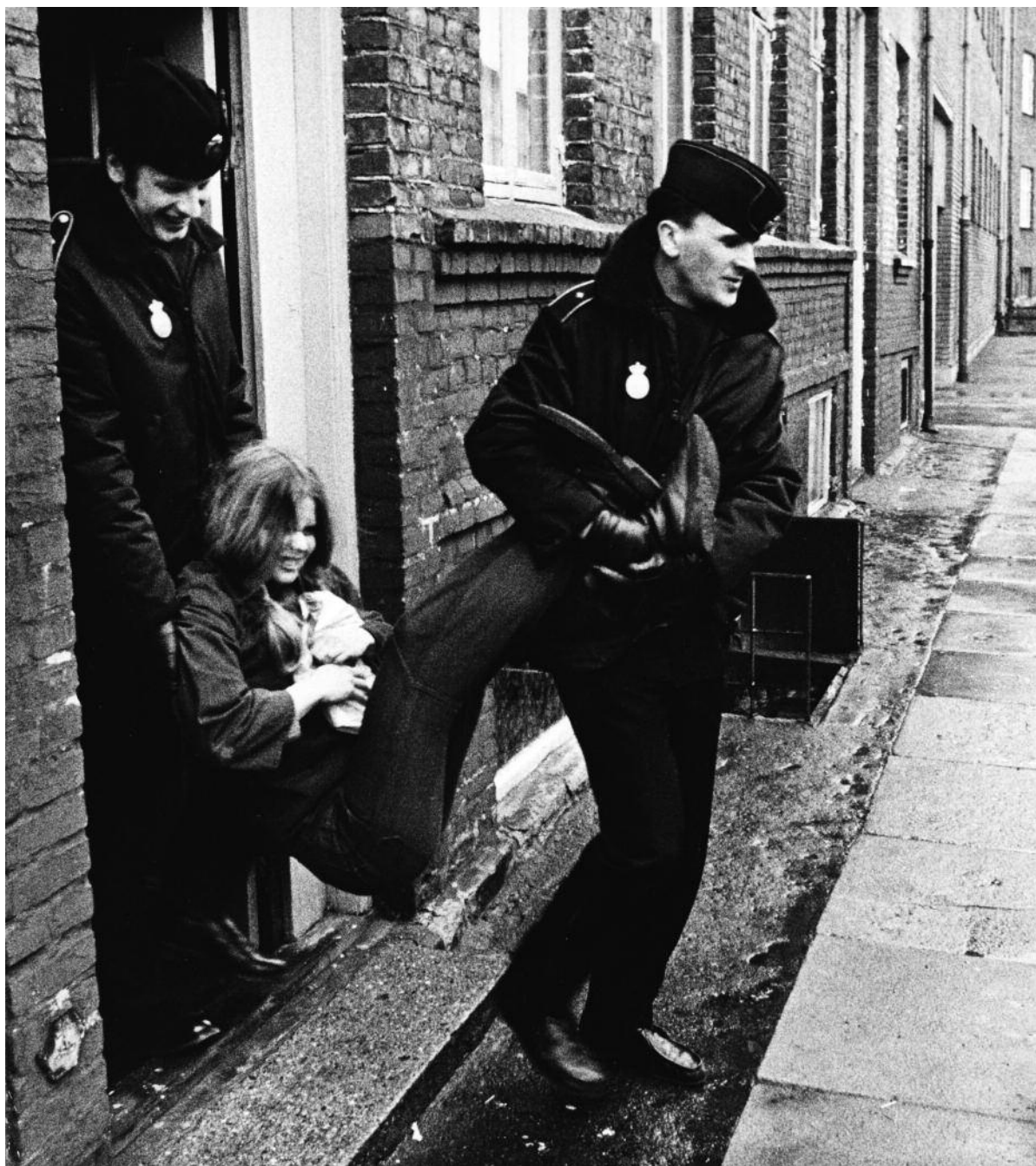
Den slags vil vi ikke have her. Politiet fjerner slumstormere fra ejendommen H.V. Nyholmsvej 3-5 på Frederiksberg ca. 1970.

hold i hint øde, nedslidte og mærkelige landskab. For det udstillingsvindue for den “avancerede kapitalisme”, som universitetet