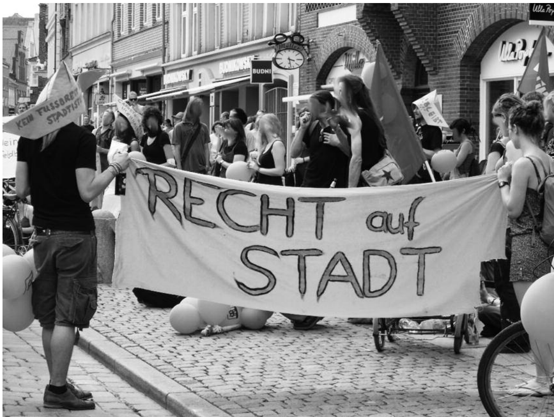
Recht auf Stadt – demonstration i Lüneburg 7. juli 2012

ved bl.a. at illustrere, hvordan den situationistiske ansats i innovationen i kapitalistisk økonomi og samfund opfattes og mødes. 39