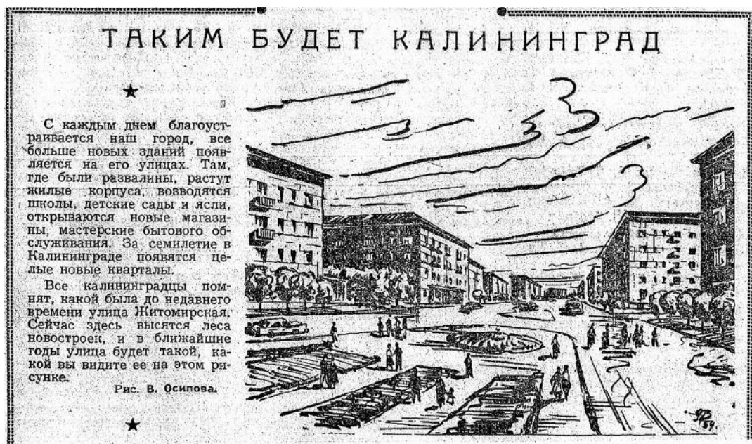
'Således bliver Kaliningrad'. Informerende notits til Kaliningrads indbyggere. Kaliningradskaja Pravda, 1950'erne.

“Målet... er at opbygge det sovjetiske Kaliningrad. ... Befrielsen af jordens århundredlange fangenskab skal smykke ... lyset, og dette udsmykkede lys vil være den vestligste af byerne i de sovjetiske lande – Kaliningrad.” 22