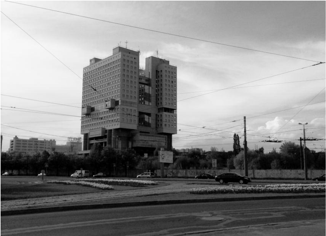
Dom Sovjetov. Bygningen nåede aldrig at komme i brug, og står nu som et tomt monument over Kaliningrads historie. Privatfoto fra studierejse, maj 2010.

denne ved at opstille diverse mindesmærker til erindring om den store sejr. 41 På denne måde forstærkedes opbygningen af homo sovjeticus kaliningradensis .