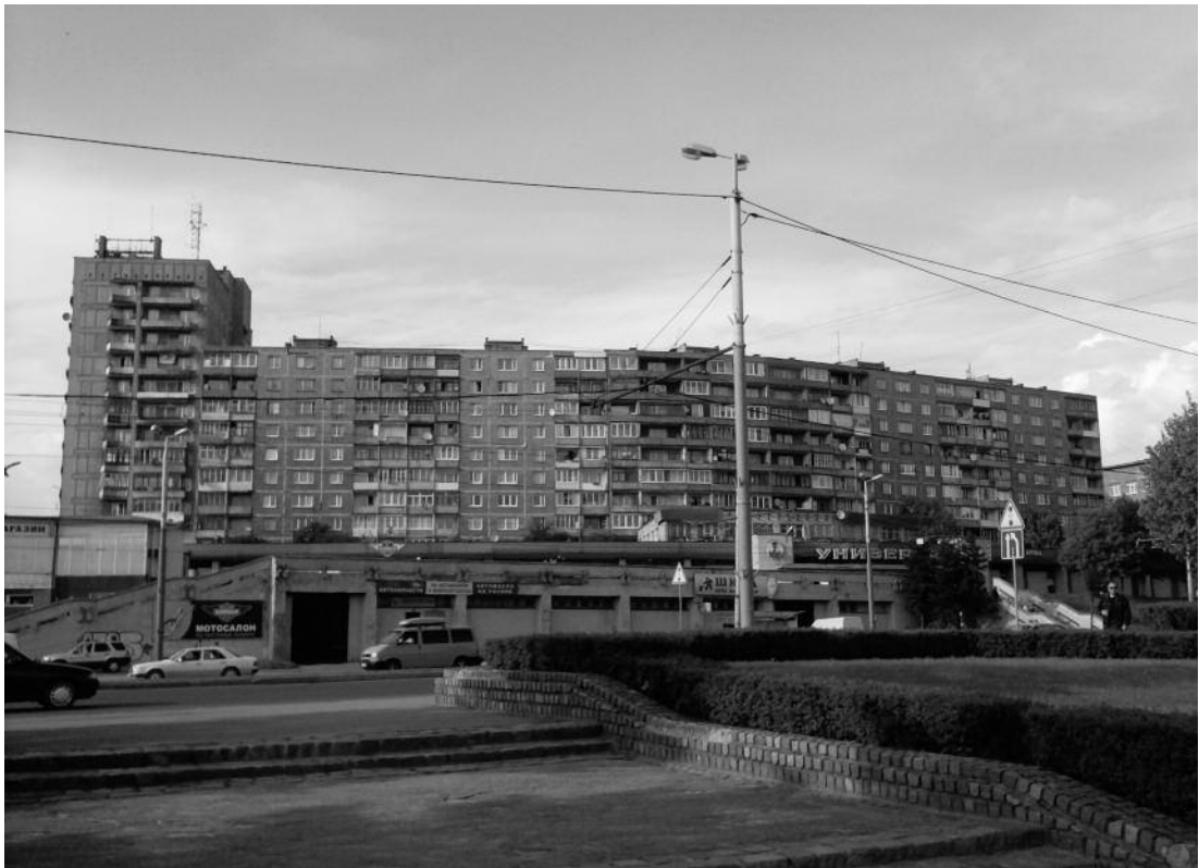
En planlagt mikrorajon som den tager sig ud i dag nær Kaliningrads centrale plads. Privatfoto fra studierejse, maj 2010.

ges, eller om disse skulle ombygges og udvides efter det socialistiske tidsbillede. Generalplanen af 1935 var konstrueret omkring en række praktiske og ideologiske principper, og blev en rettesnor for den fremtidige byplanlægning i Sovjetunionen. Som udgangspunkt fokuserede planen mere på de praktiske aspekter af byplanlægningen, men det blev stadigvæk holdt in mente, at byen skulle tjene et ideologisk formål til udviklingen af det sovjetiske menneske.