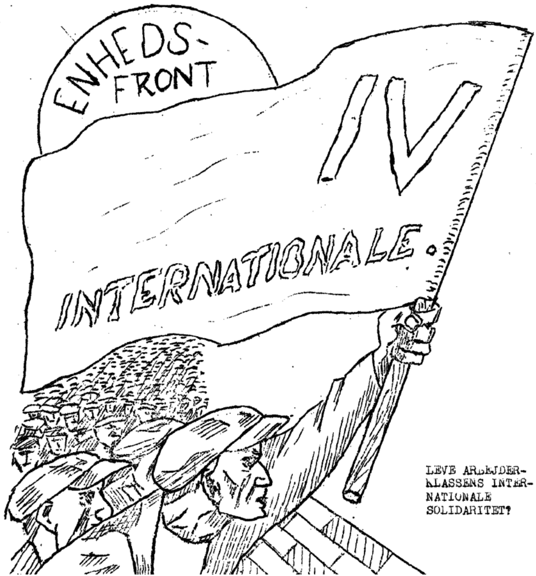
Alverdens revolutionære arbejdere samles bag Fjerde Internationales banner. En forsideillustration til trotskisternes illegale blad Klassekampen, 1944.

søgte at indvirke på bevægelserne gennem flyveblade og tidsskriftet Arbejderopposition , som var langt mere agitatorisk anlagt end det sideløbende Arbejderpolitik , men også mindre entydigt trotskistisk. 32