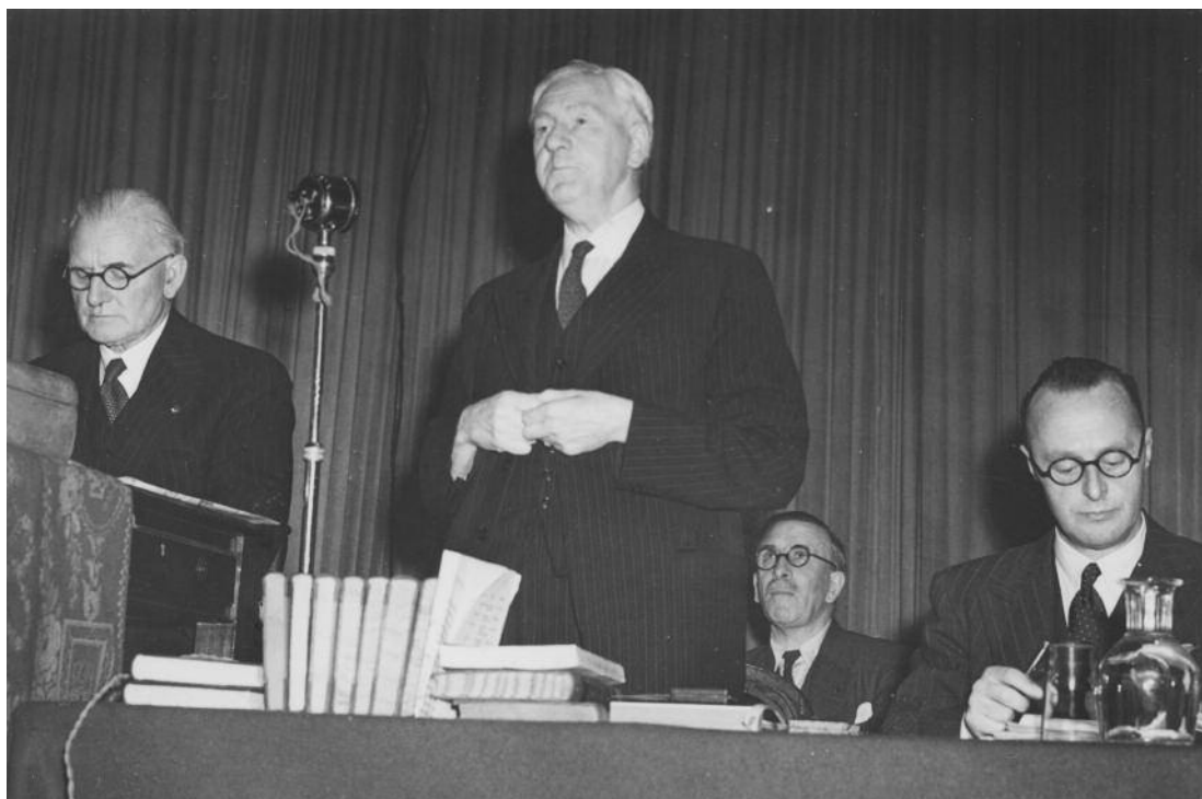
Walther Citrine (1887-1983), engelsk fagforeningsleder og socialdemokratisk politiker. Han var præsident for The International Confederations of Free Trade Unions 1928-1945. På billedet åbner han TUCs kongres I 1946.

kontrol og gennemførelse af arbejderbeskyttelse. Det socialpolitiske program blev diskuteret både i medlemsorganisationer og centralt og blev genstand for en ny behandling i forbindelse med kongressen i Bryssel i 1933. 52