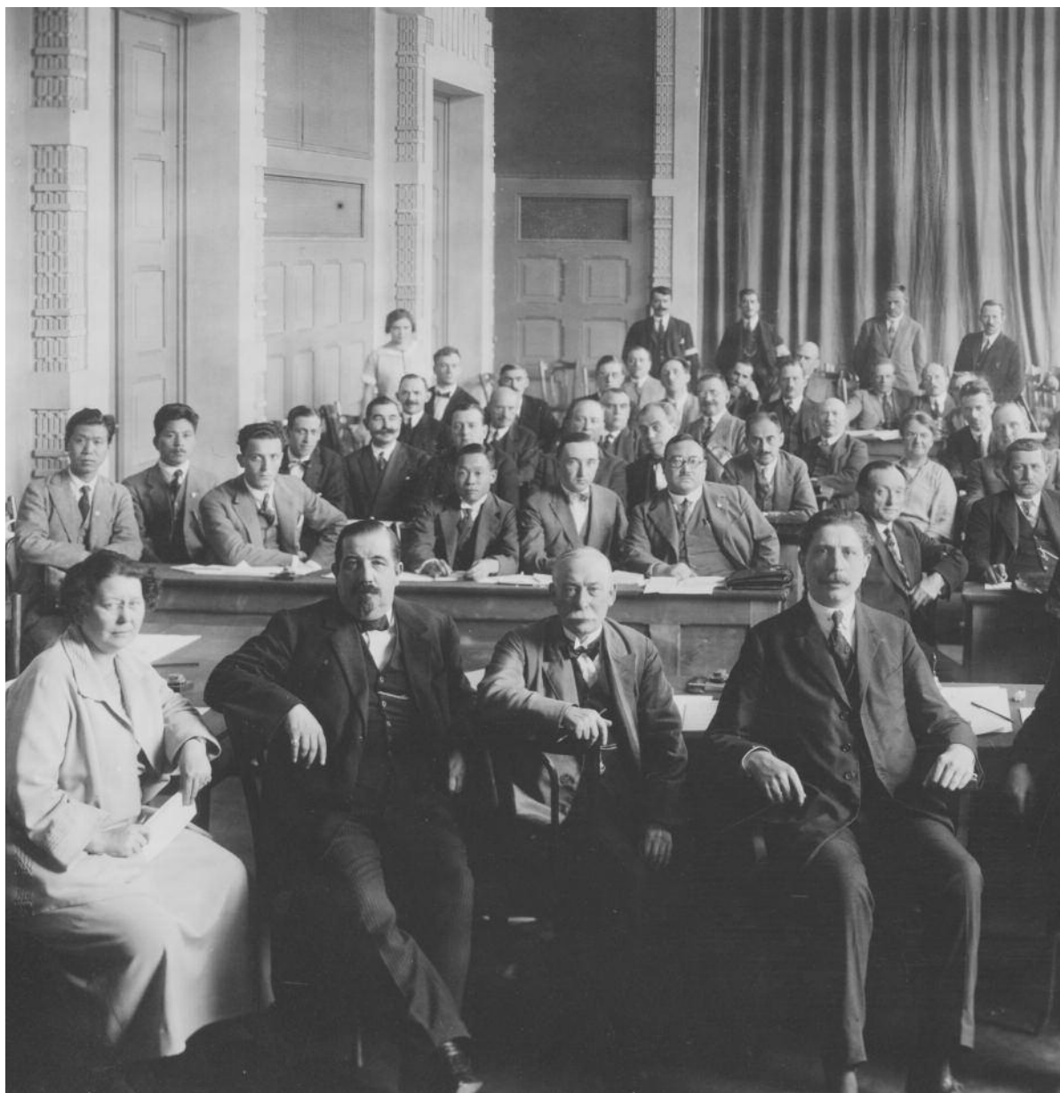
Arbejderrepræsentanterne til ILOs arbejdskonference i Geneve 1924.