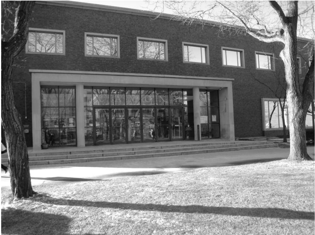
Lamont Library.

alet til en oversigt over planerne for sovjetisk kulturvirksomhed i 1965-66 så ledes ikke – som anført – informationer om planerne for Danmark, men for Polen. 3