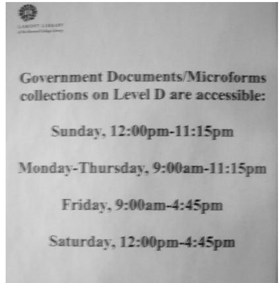
Skilt med åbningstider for kælderen med mikrofilm.

Dog blev kælderen lukket nogle timer hver nat sammen med servicedisken. Til gengæld måtte man slæbe så mange mikrofilmæsker op og have stående, som man orkede, og som regel kunne de stå fremme over flere dage. Personligt benyttede jeg mig flere gange af den mulighed. Efter brug stilles æskerne på en rullevojn. Personalet sætter dem på plads.