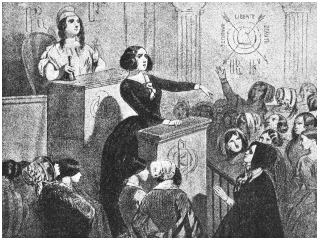
Kvindemøde i 1830'erne i Paris: "Arbejdskvinder! Lad os gå til regeringen og forlange kortere arbejdstid og højere løn. Republikken leve." Saint-simonismen gik ind for ligestilling mellem kønnene. (Samtidigt billede). Kilde: C.E.Jensen m.fl.: Socialdemokratiets århundrede, bd. 1, s.101

ter i stigende grad afstand til saint-simonismen som et led i den nye bølge af samfundsomvæltende socialistiske og kommunistiske tanker.