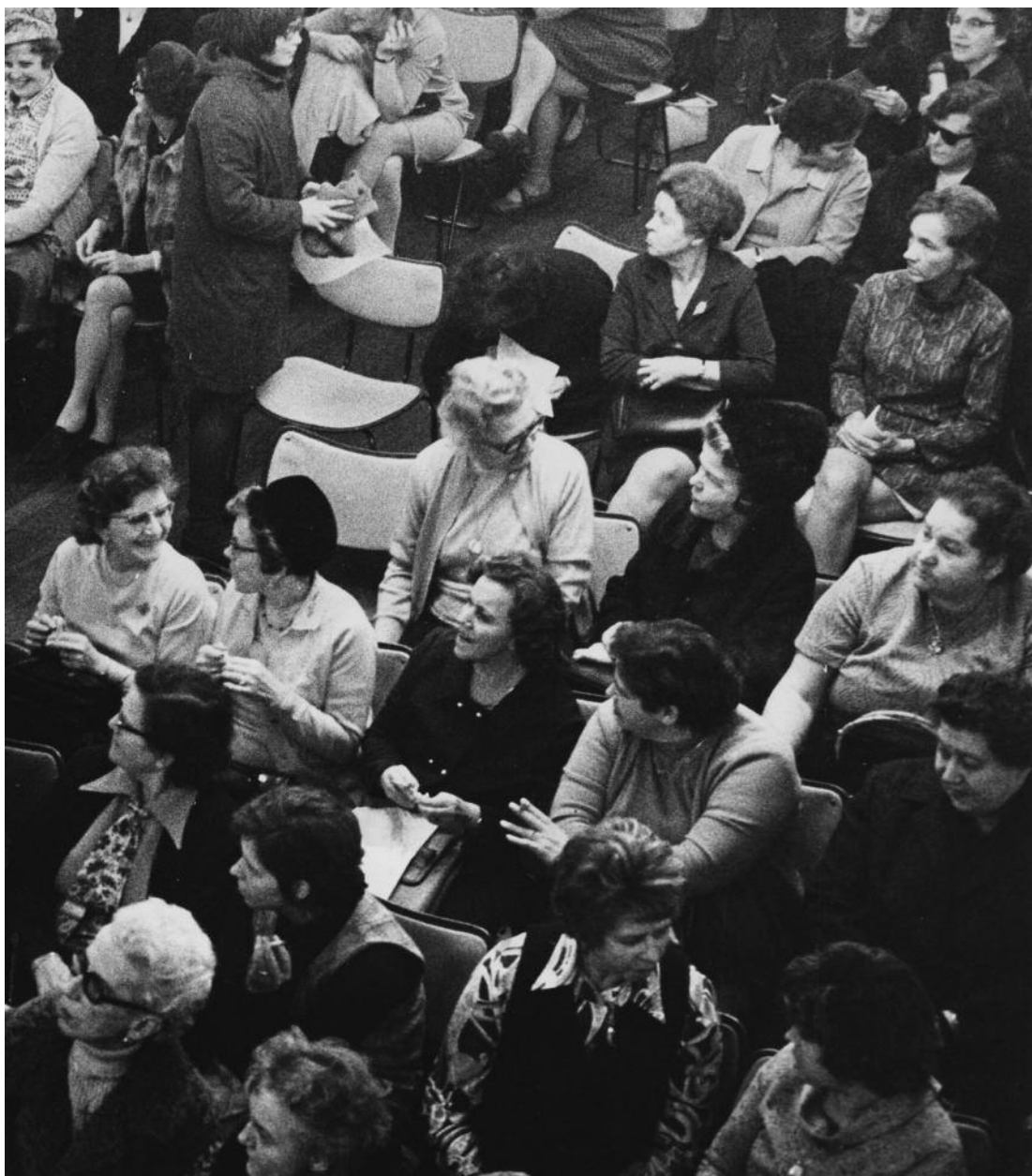
Bryggerikvinder samlet med andre arbejderekvinder og kvinder fra den ny kvindebevægelse i Folkets Hus på Enghavevej for at diskutere ligeløn, 1971.

rede de, at deres arbejde var af samme værdi som mændenes, og at kvinderne var lige så værdifulde som mændene. En ung kvinde havde ikke været ansat på Carlsberg længe, før hun i en tale for sine kolleger spurgte: