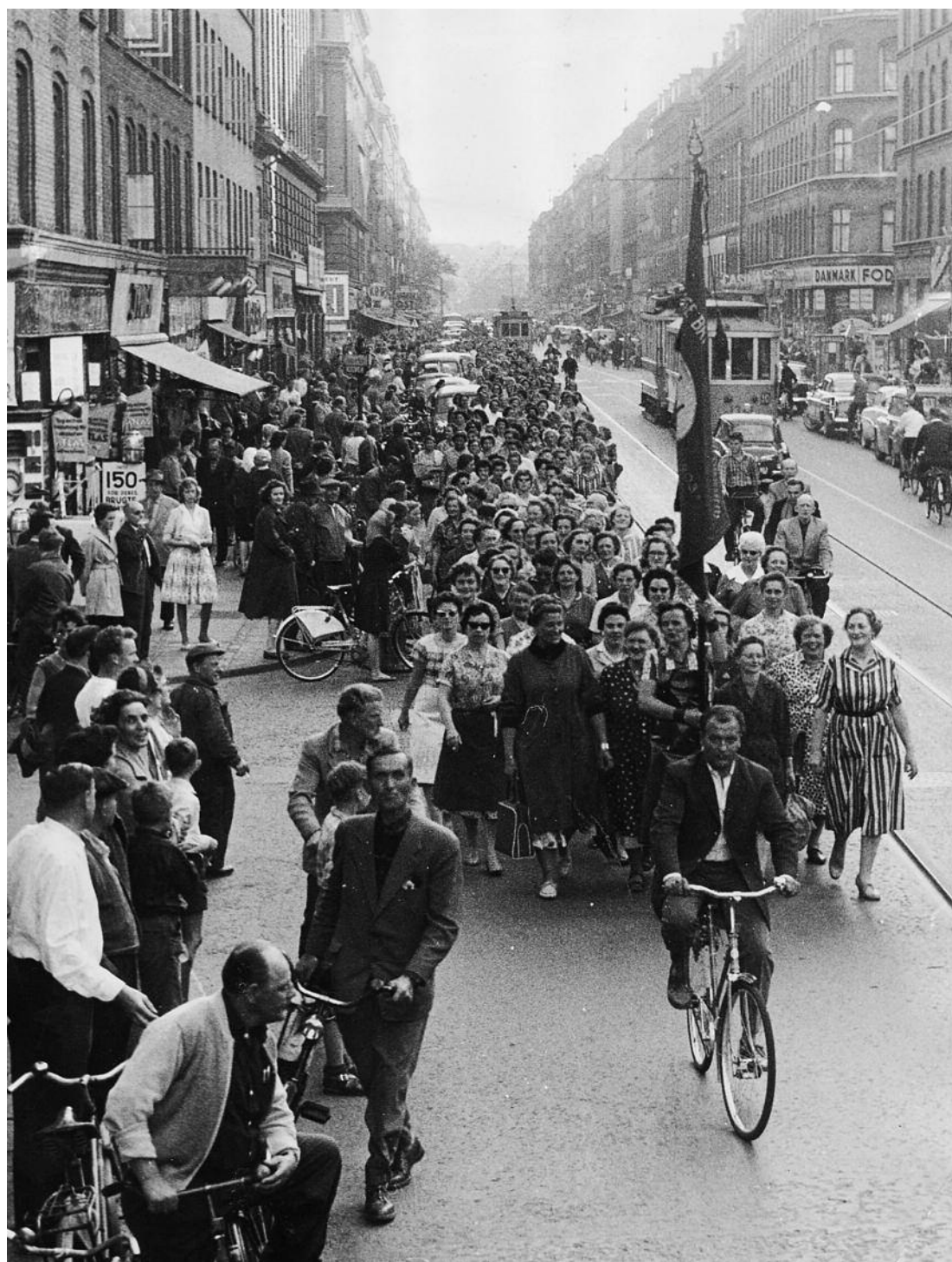
Kvindelige bryggeriarbejdere i demonstration på Istedgade, 1960. Mændene havde fået et højere tillæg, end de havde. Strejken varede i næsten to uger. De efterfølgende forhandlinger gav kvinderne samme løntillæg som mændene.