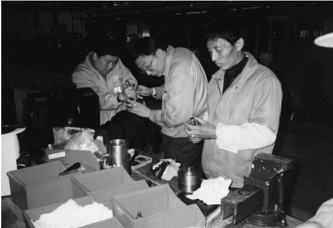
Kina er en af Østasiens største økonomier, som danske virksomheder også flytter til. Carlsberg åbnede et bryggeri i Shanghai i 1999. Her er nogle af arbejderne ved at samle ventiler.