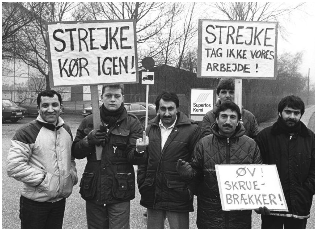
På arbejdspladserne står "gammel"- og "nydanskere" sammen – også når der strejkes. Strejke på Frederiksberg Metalvarefabrik i 1978.

med eksplicit at diskutere normative problemstillinger. Dette er forstærket af mainstream-økonomiens forsøg på at få karakter af en videnskab, der i præcision og formaliseringsgrad kan sammenlignes med naturvidenskaber som fysik. Mange førende økonomer har drømt om at blive samfundsvidenskabens Newton.