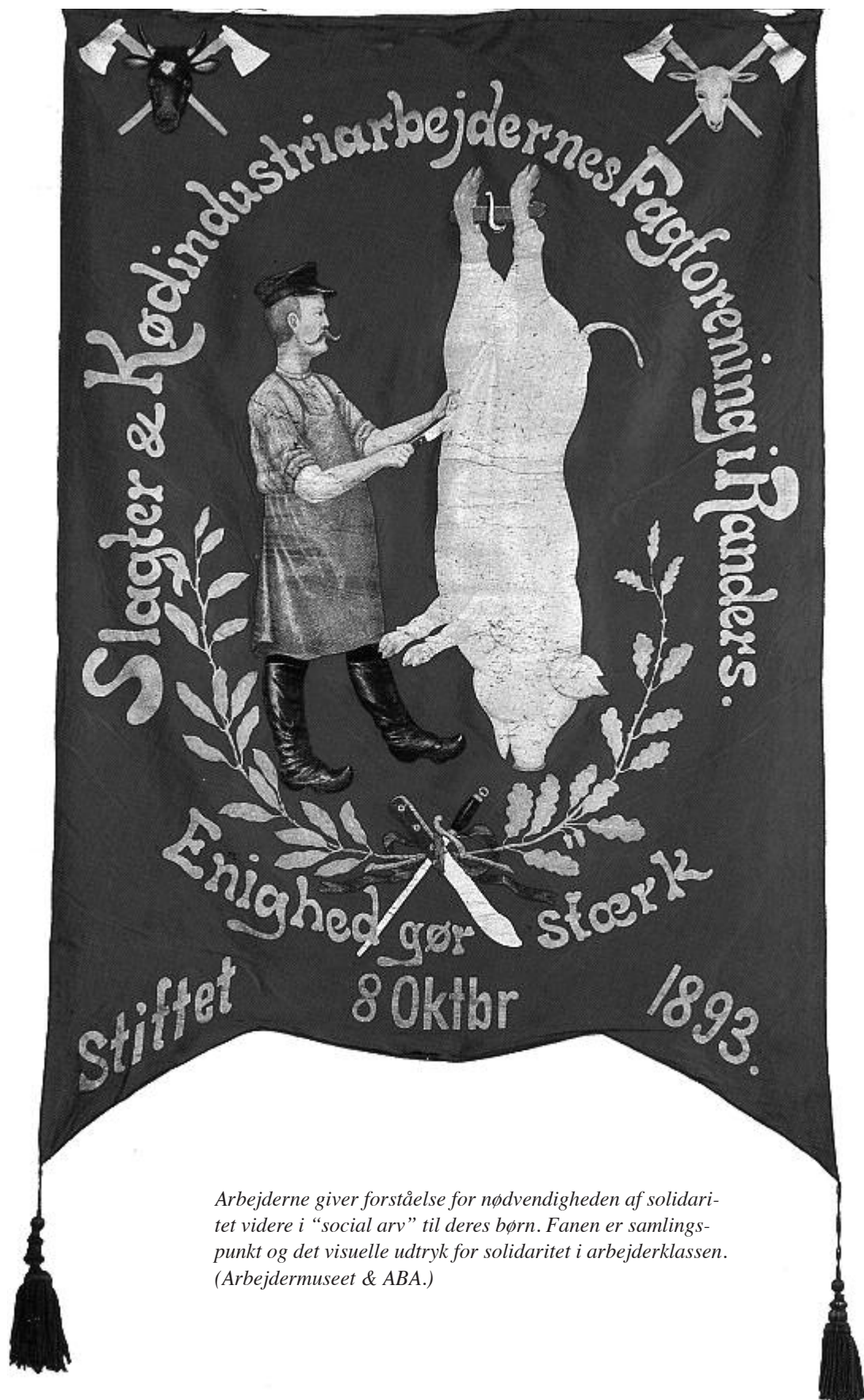
Arbejderne giver forståelse for nødvendigheden af solidaritet videre i "social arv" til deres børn. Fanen er samlingspunkt og det visuelle udtryk for solidaritet i arbejderklassen.