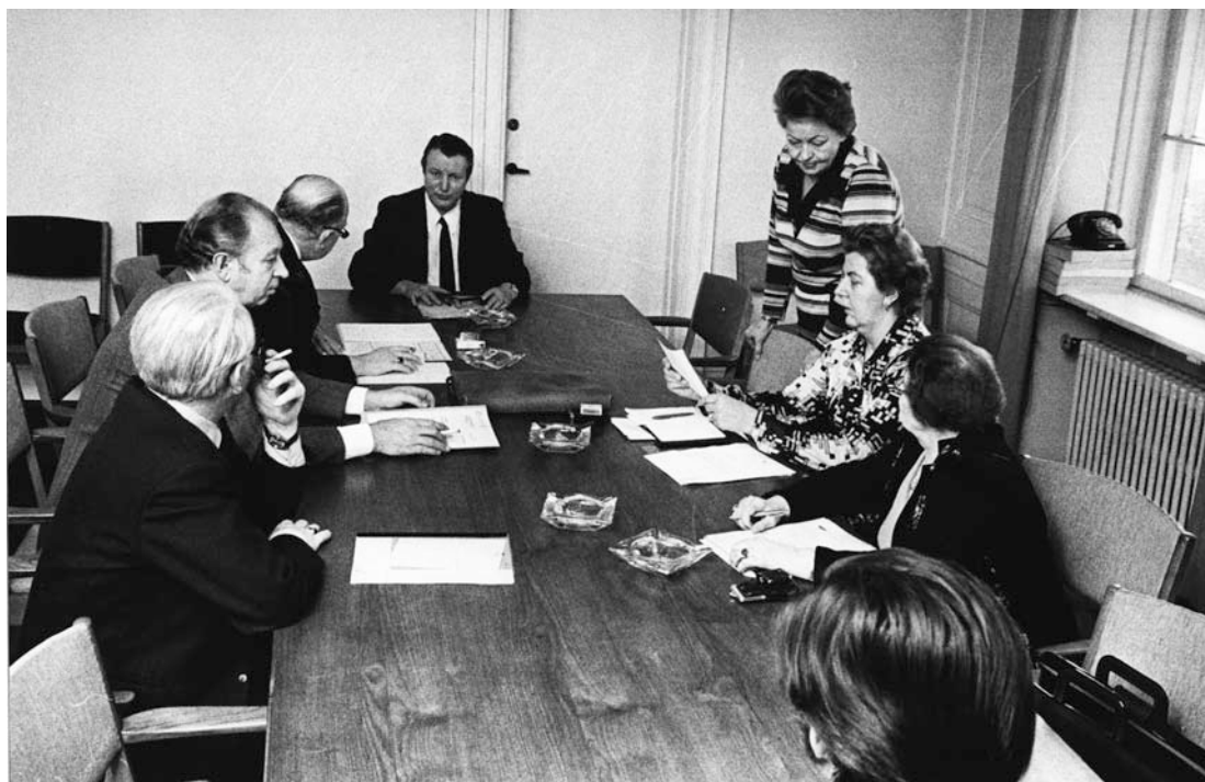
Fagbevægelsen forhandler løn- og arbejdsforhold på medlemmernes vegne og har ekspertise til at sanktionere deres overholdelse. Overenskomstforhandlinger i 1975. Fagbevægelsens øverste forhandlere lægger strategi.

ste denne alliance sig at give resultater for de arbejdere, som var ivrige efter at forbedre deres løn- og arbejdsforhold. Hermed var der også grobund for Pios og andres agitation for det videre perspektiv: en socialistisk samfundsforandring.