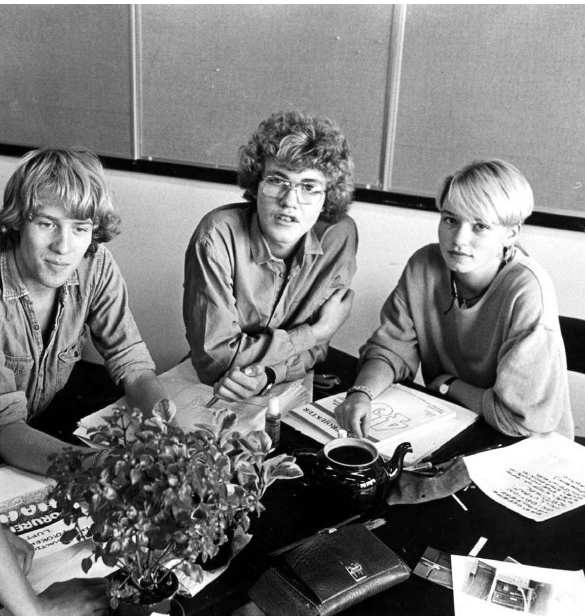
Gymnasieelever arbejder sammen på et projekt på Herlev Statsskole i 1983.

gennemført en samordning af ungdomsuddannelserne var slået fejl. Symptomatisk for denne udvikling var det forsøg, som blev gennemført i Tilst ved Århus på Langkjær Gymnasium på trods af mange ildsjæles indsats måtte opgives. Det var ganske enkelt dengang