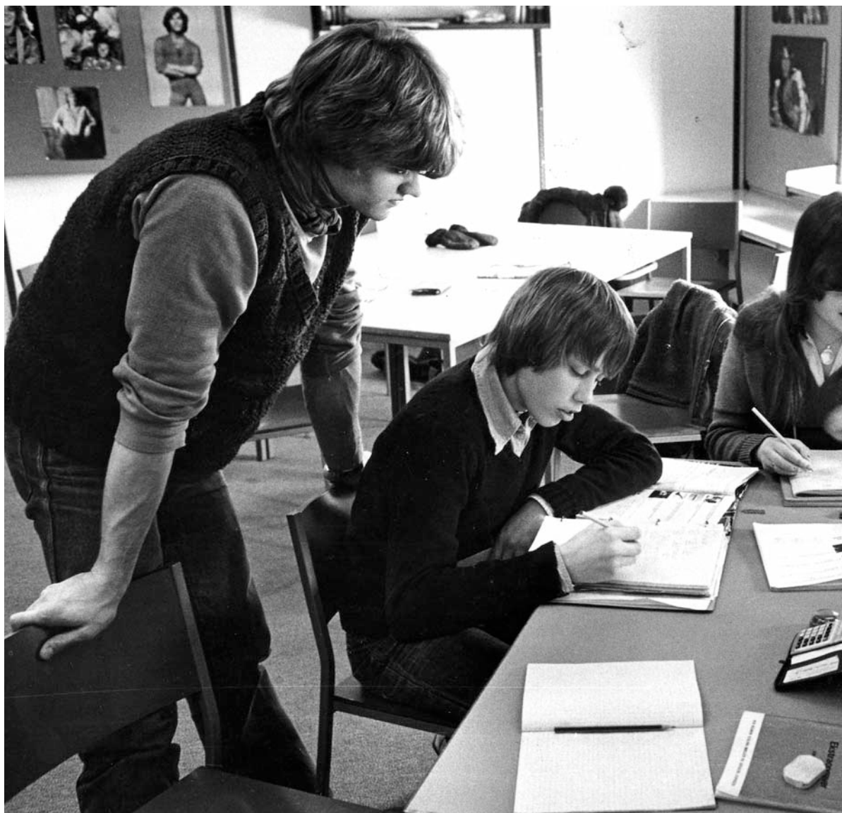
Ændringer i samfundet stillede nye krav til Folkeskolen. Nye undervisningsformer som styrkede samarbejdet blev taget i brug. Grupperarbejde i en matematiktime i Folkeskolen.

åndens og håndens arbejde, som var nyt i 1970ernes uddannelsesdebat, men som jo allerede Rousseau og Grundtvig, blandt andre, havde været fortalere for. I 1977 udsendte Undervisningsministeriet et cirkulære, der skulle øge interessen for, at elever fra gymnasiet og hf kom i praktik i erhvervslivet, og ganske mange gymnasier udnyttede denne mulighed,