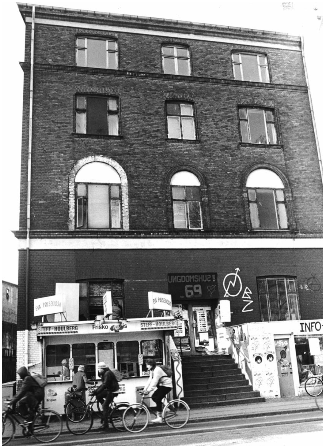
Ungdomshuset på Jagtvej 69 på Nørrebro. A/S Arbejdernes Forsamlingsbygning stod bag opførelsen af huset, som blev indviet i 1897. Huset fungerede i mange år som forsamlingsbygning for den københavnske arbejderbevægelse. I 1982 overdrog Københavns kommune huset som ungdomshus til unge, der kom fra BZ-miljøet. Huset blev herefter samlingssted og spillested for denne gruppe af unge. (Foto: Arbejdermuseet & ABA. Fotograf: Ole Wildt, 1984).