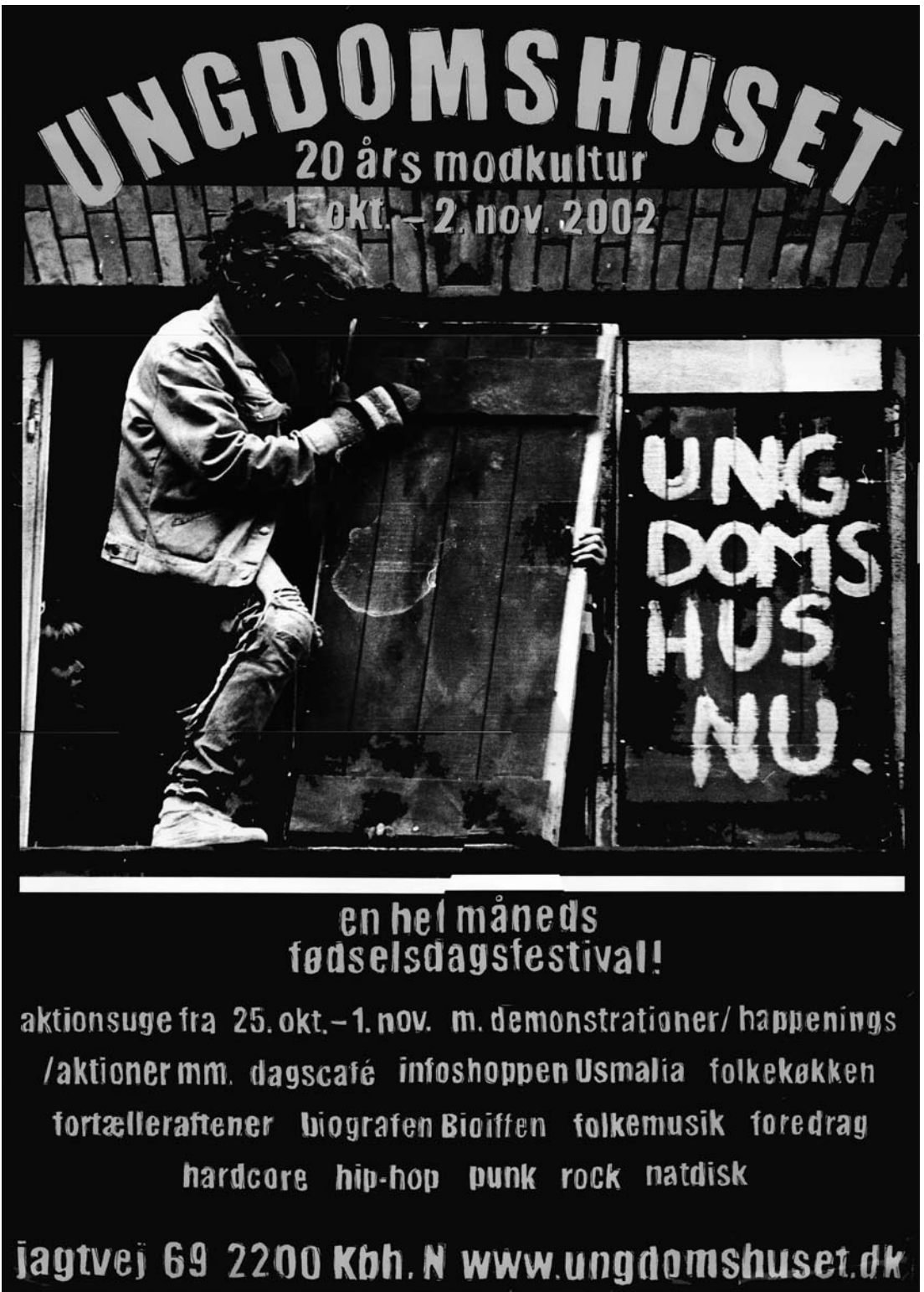
Ungdomshuset, 20 års modkultur. Fødselsdagsplakat fra 2002.