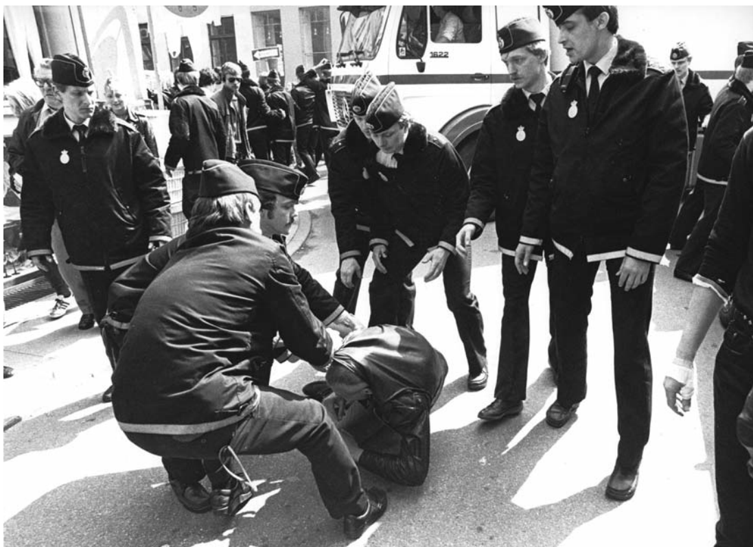
BZere i nærkontakt med politiet i Sankt Pederstræde. BZerne havde besat det tomme hus, som politiet er ved at sætte dem ud af. (Foto: Arbejdermuseet & ABA, Fotograf: Finn Svensson, 1983).

sik-miljø og et mødested for flere politiske grupper på den yderste venstrefløj. Stedet tiltrak i månederne op til rydningen i stigende grad unge fra helt andre kulturelle miljøer som fx reggae-verdenen og queer-bevægelsen, der var frastødt af hvad de så som voksende højredrejning, racisme og intolerance i samfundet. Disse mennesker havde forskellig musik- og tøjsmag, og kom fra forskellige sociale baggrunde, men de var enige om at være imod den "ensretning", som de forbandt med Fogh-regeringens politik. Den 100 år gamle bygning på Jagtvej med sin nærmest magiske atmosfære viste sig at være en perfekt ramme om så forskellige arrangementer som løsslupne lesbiske "pussy-parties" 22 og mere puritanske veganske folkekøkkener, hvor kød og mælkeprodukter var bandlyst.