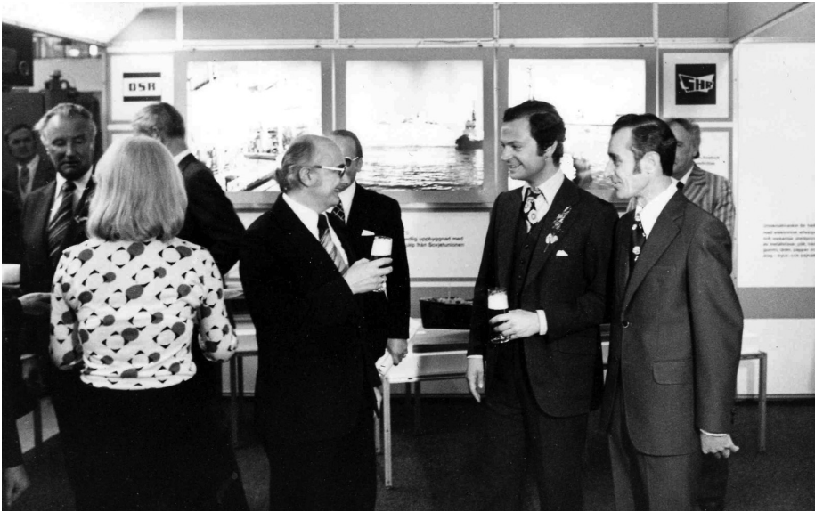
Den svenske konge i behagelig samtale med DDR-repræsentanter fra firmaet VEB Deutsche Seereederei på St. Eriksmessen i 1975.

SED-partiorganisation briefet bønderne og arbejderne om, hvordan de skulle svare og reagere. Endvidere var besøgsmaalene også udvalgt, så det drejede sig om mønstervirksomheder, der kunne leve op til lovordene om socialistisk udvikling. 54