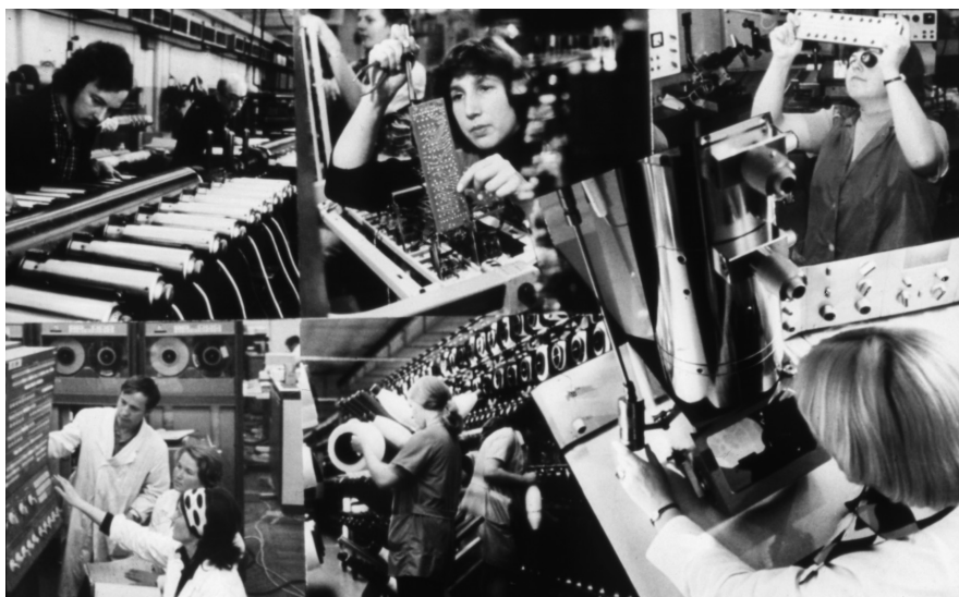
Der skulle ikke være nogen tvivl. DDR benyttede de nyeste former for produktionsteknik. Billedet og dyrkelsen af det moderne industrisamfund stod centralt i det østtyske styres selvforståelse af "Arbejder og Bondestaten".

særligt Sverige, der blandt andet importerede kalisalt fra området. Efter forhandlinger med de sovjetiske myndigheder udviklede handlen sig i starten ganske gunstig, hvilket betød, at Sverige frem til valutareformen i vestzonerne i 1948 havde et større handelsomkvem med Østtyskland end med det øvrige Tyskland. Samme år dukkede de første østtyske repræsentanter også op på den vigtige svenske St. Eriksmesse. Den Kolde Krigs tilspidsning og oprettelsen af de to tyske stater i 1949 varslede imidlertid nye udfordringer på baggrund af de politiske implikationer, der fremover var forbundet med kontakten til DDR-styret. 2