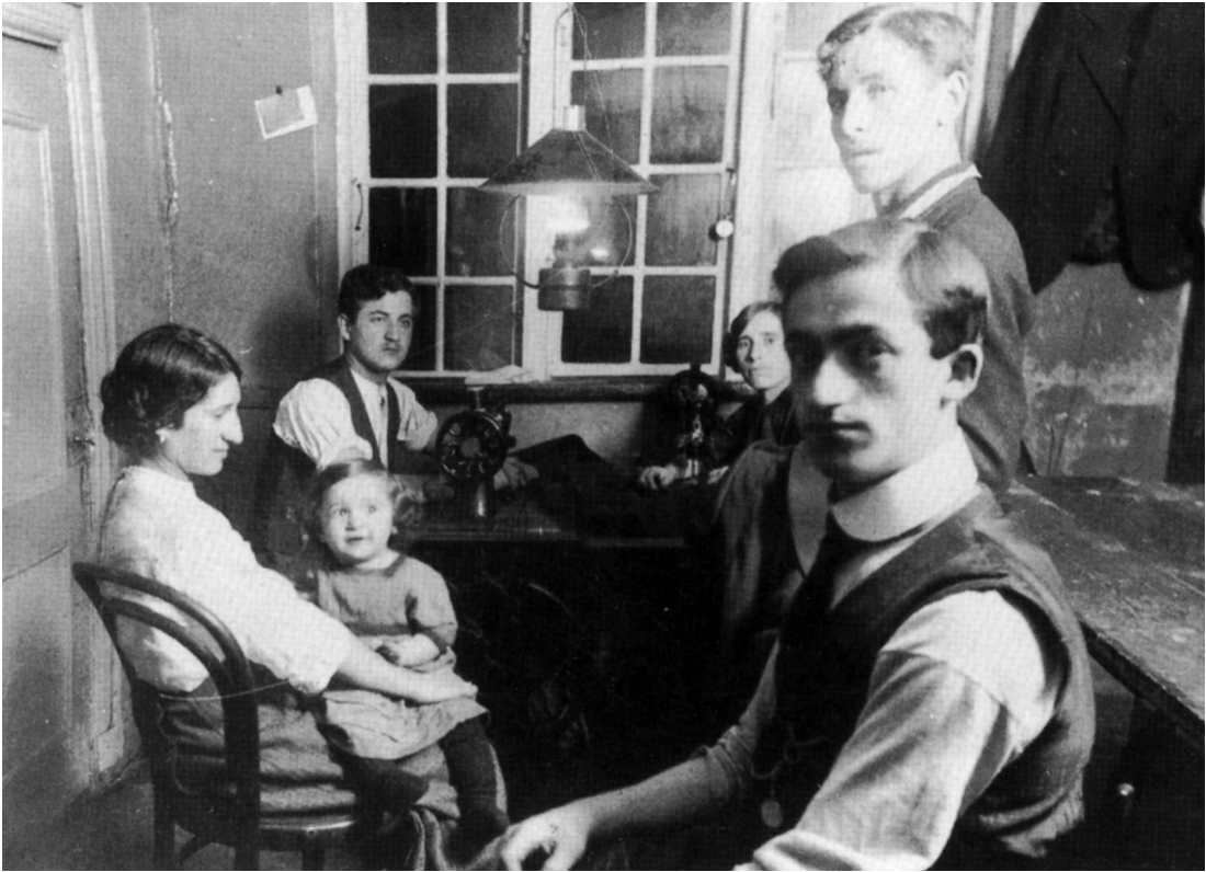
Skrædderværksted hos familien Rosenbaum ca. 1914.

han konfektionsarbejdet (lagerarbejde), hvor kvindetariffen lå 25% under den mandlige: