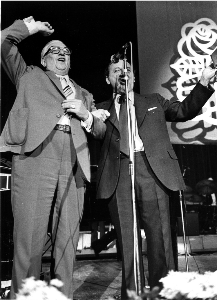
Partiformand Anker Jørgensen og LO-formand Thomas Nielsen på Socialdemokratiets kongres 1977 gør gode miner til slet spil. Bølgerne gik højt både i partiet og mellem partiledelse og LO i disse år.

de det nationale tema (begreber som nationen og folket), 12 får man regnestykket: sociale reformer + nation = velfærdsstat. Det er muligvis ikke helt matematisk stringent, men jeg tror, at beregningen holder historisk vand.