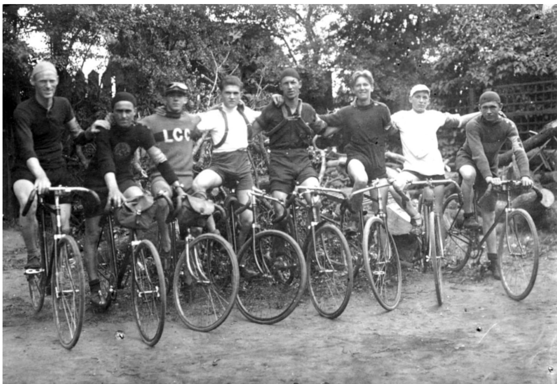
På fotografiet fra omkring midten af 1920 ses en række Lyngby-ryttere, der må formodes at have hørt til de bedste i cykelklubben.

punkt, at DBC ikke blot havde afgørende indflydelse inden for banesporten, men også vedrørende afholdelse af landevejsløb både nationalt og internationalt.