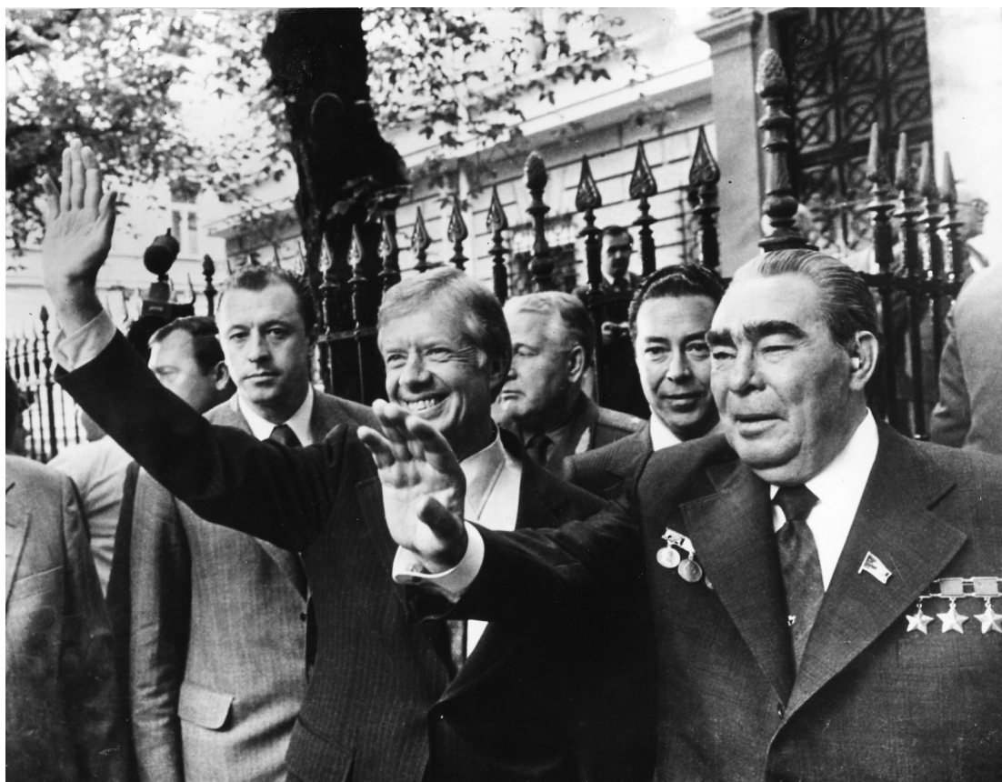
Leonid Bresjnev og Jimmy Carter vinker til Wiens borgere i forbindelse SALT II-forhandlingerne i 1979.

Det er en af redegørelsens svagheder, at analysen af den ultra-offensive sovjetiske krigsstrategi ikke udvikles, så det fremstår tydeligere, hvorfor krigsstrategien udgjorde en stærkt destabiliserende og spændingsskabende faktor i Vesten, også selvom der ikke eksisterede reelle sovjetiske intentioner om et uprovokeret angreb på Vesten. I den forbindelse ville det have været oplagt at inddrage amerikanske vurderinger af styrkeforholdet mellem øst og vest. Carter-administrationens tophemmelige opgørelse over det militære styrkeforhold fra april 1977 anslog, at udfaldet af en konventionel krig i Europa i høj grad afhang af, om en af parterne fik et mobiliseringsforspring. Hvis NATO mobiliserede for sent, vil-