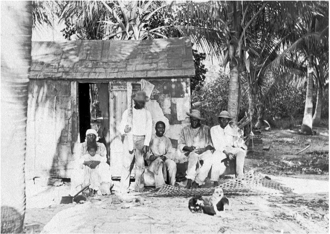
Landarbejdere foran deres bolig. St. Croix.

Liberia Association , 46 men bevægelsen opnåede aldrig større indflydelse og døde hurtigt ud.