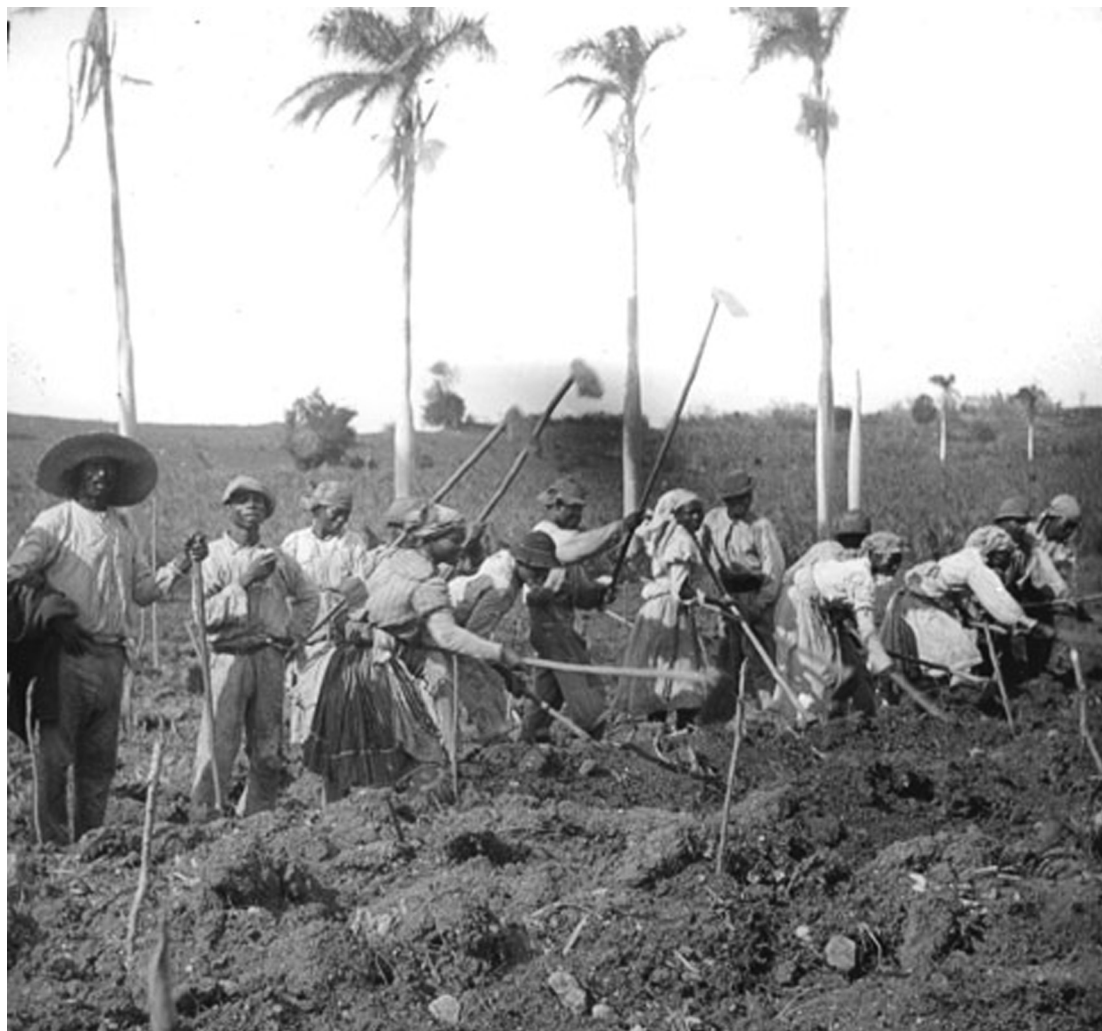
Landarbejdere igang med at forberede såning af sukkerrør. St. Croix.

delsen af den nye junigrundlov satte han sig ind i den danske arbejderbevægelses udviklingshistorie.