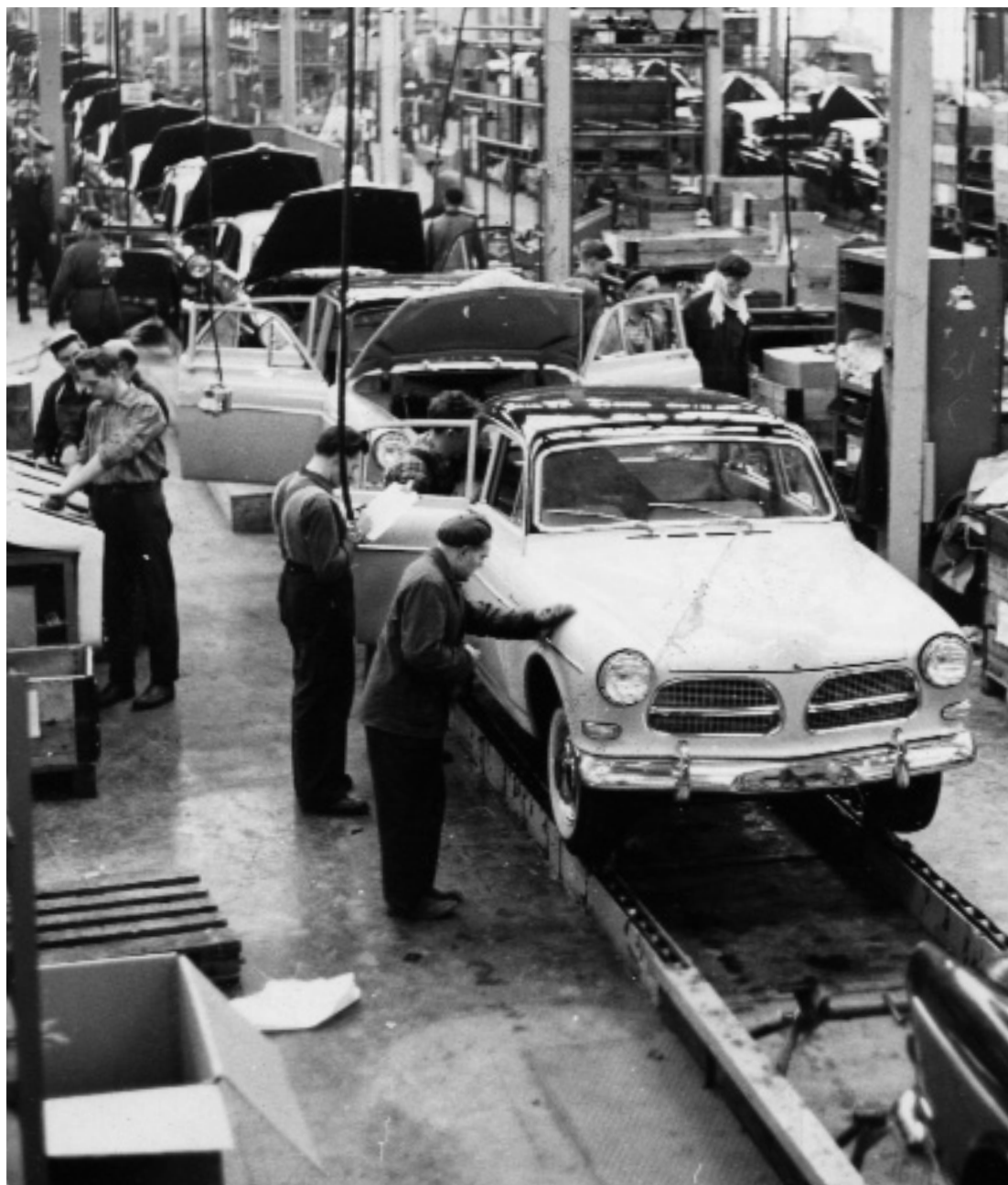
I Sverige har Volvo været et stærkt samlende symbol. Her et billede fra en Volvofabrik fra starten af 1960'erne.

Man stod med andre ord til ansvar både over for sig selv, over for andre borgere og over for nationssamfundet som helhed. Men dette råb om kulturel modenhed og social-moralsk hjælp til selvhjælp mindede nu mest af alt om