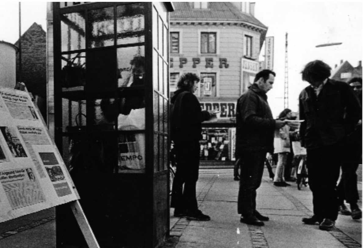
DKP på gaden op til folkeafstemningen om dansk medlemskab af EF i 1972. Plakaten til venstre opsummerer godt, hvad partiet ville have valgkampen til at handle om: forsvaret af nationen mod den internationale monopolkapitalisme.

sekvent den sovjetiske fortrop. Særligt i forbindelse med Kina (og Albanien) bakkede ledelsen i DKP entydigt op omkring Sovjetunionens dispositioner. De få danske "kinesere", der var i partiet, blev ekskluderet. Ellers var taktikken i starten af 1960'erne at undgå mere splittelse i partiet ved at lægge så meget låg på diskussionerne som muligt. 35