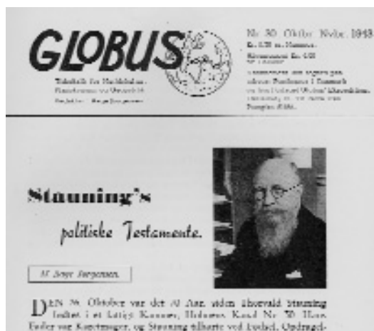
Fra forsiden af tidsskriftet GLOBUS, nr. 30 okt.-nov. 1943. (ABA)

Danmarks besættelse og den følgende økono-