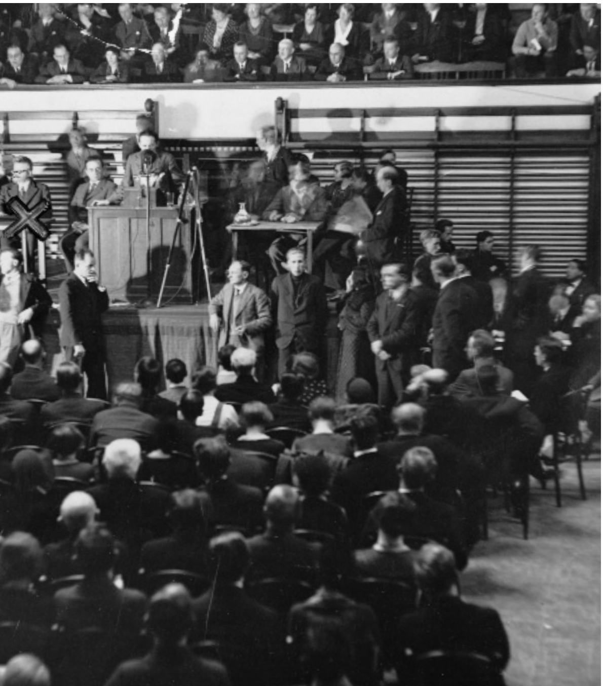
Leon Trotskij talte ved et møde i Idrætshuset i København d. 27. november 1932. Han var inviteret af Socialdemokratiske Studenter. Mødet blev et tilløbsstykke, idet der mødte omkring 2000 tilhørere op. Trotskij sidder på podiet nr 2 fra venstre.