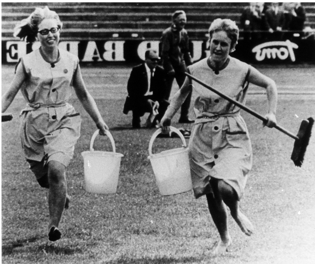
Fagenes Fest. “Skrubberne” 1965.