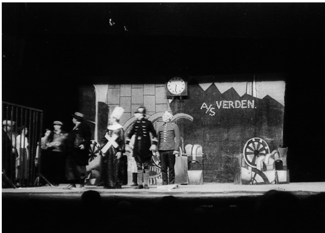
R.T. Sketchen "Proletariatets diktatur", Arbejderne har fundet sammen i enhedsfronten. Kapitalen har hentet forstærkning, Præsten, Politimanden og Militærmanden. Det hjælper ikke, arbejderne er på vej til at smadre gitteret.

bagtæppet, der forestillede en fabrik, stod: "A/S Verden" og højt oppe hang et stort ur. Det begyndte at gå, således at arbejdstiden fra kl. 7 til 16 gik på ganske få minutter. Den første del var rent pantomimisk. Tre arbejdere trådte ind og begyndte at betjene de tre stiliserede maskiner, der producerede pengestykker. I teksten er det medgivet, at det fremstår som en simplificering at maskinerne producerer pengestykker! Da arbejdstiden var ovre, tildelte Kapitalen hver arbejder to pengestykker fra sin bunke og resten blev puttet i Kapitalens sæk. Alle forlod scenen, uret løb stadig, og da klokken igen blev 7, indtog arbejderne på ny deres plads ved maskinerne. Da Arbejder 1 havde produceret sin egen løn (to pengestykker), standsede han, og opfordrede de andre til at stoppe al yderligere produktion, der