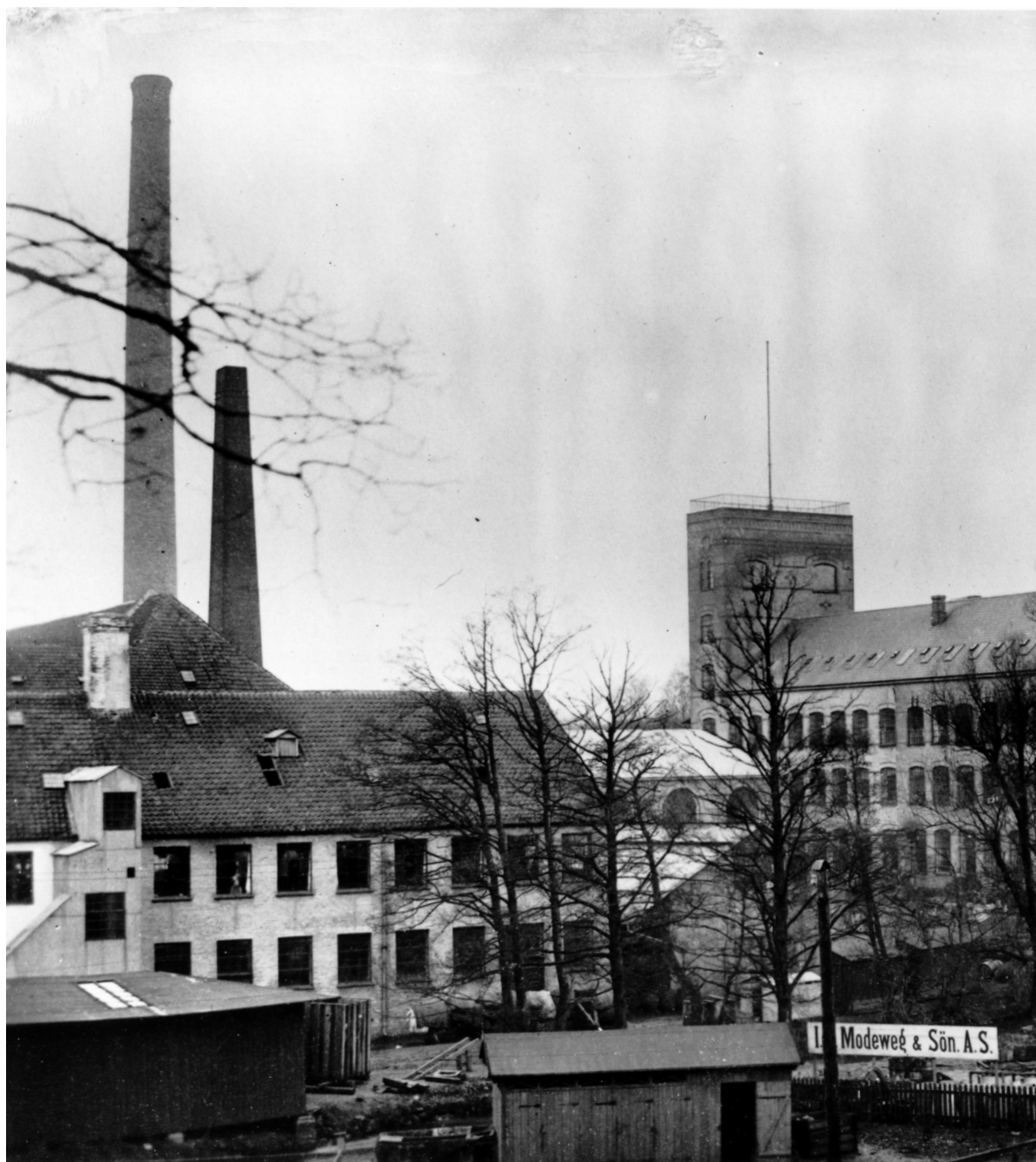
Brede Klædefabrik i 1905. Billedet er taget fra den i 1899 anlagte jernbaneforbindelse mellem Lyngby og Nærum, der lettede tilgang af råvarer og udkørsel af færdigvarer til den store produktionsenhed. På dette tidspunkt har klædefabrikken omtrent 500 ansatte, mere end halvdelen bor i lejligheder, der er tilknyttet virksomheden.