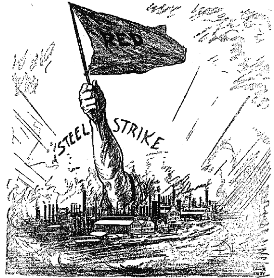
'Coming out of the Smoke' er titlen på denne tegning fra New York-bladet World 25. september 1919, 3 dage efter den store stålstrejke begyndte.

Mens arbejderne således var fornuftige og loyale og havde afvist bolshevismen, så var andre grupper ifølge AFL faldet for kommunisternes gyldne løfter. En af dem var de intellektuelle, de liberale og "salon-kommunisterne" fra middelklassen, som havde mistet forbindelsen med det almindelige liv og som kritisk fulgte de idéer, som netop nu var på mode i elfenbenstårnene. 44 En anden var erhvervslivet, som enten indirekte hjalp bolshevikkerne ved at bekæmpe AFL, som jo var demokratiets vigtigste bolværk, eller direkte ved i deres principløse jagt på profit at handle med og investere i Sovjet-styret, og dermed redde det fra den totale økonomiske kollaps og samtidig bringe det nærmere til en diplomatisk anerkendelse fra USAs side: "Verdens