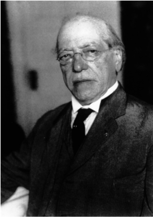
Amerikansk fagbevægelse blev ledet af lidenskabelige antikommunister som AFLs Samuel Gompers.