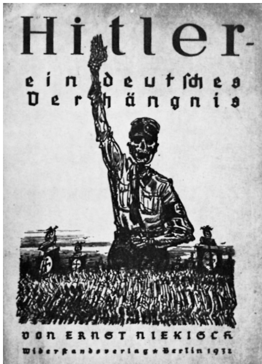
Forsiden på Niekisch' bog 'Hitler - en tysk skæbne' fra 1932.

tzau fremhævede, som Tysklands mest effektive "modgift over for den moderne individualisme, den borgerlige verdens- og samfundsopfattelse, marxismen, parlamentarismen og det moderne demokrati". 15 Moskva var for Niekisch et retningsangivende 'tegn' i tiden, der havde indskrevet sig som den hidtil mest konsekvente fornægtelse af det vestlige Europa: "Rusland står for den indtil videre mest radikale afvisning af ideerne fra 1789. Rusland er ikke individualistisk, ikke liberalistisk. Det er et land, hvor politik sættes over økonomi. Der hersker hverken parlamentarisme eller demokrati. Det er et ikke-civiliseret land. Bolsjevisme betyder at tage afstand fra humanismen og de civilisatoriske værdier". 16