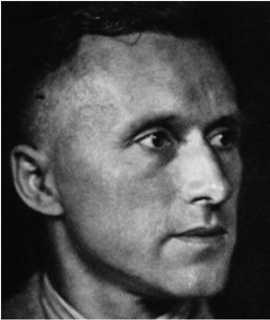
Ernst Jünger slog til lyd for en tysk krigs-socialisme.

(1918-1922) legitimerede den tyske Sonderweg under henvisning til at “enhver kultur og ethvert kulturfolk forvalter sine egne anliggender og opfylder sin skæbne i den form, der er givet det ved fødslen, og hvis væsen herefter forbliver en historisk konstant”. 7