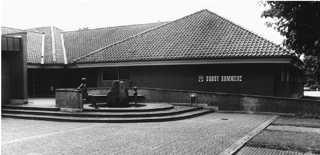
Broby rådhus, 1983

kommunalbestyrelser er et udbredt fænomen. Samtidig skal det nævnes, at der også i forbindelse med de konkurrence-fundne arkitekter kan være tale om alt andet end vovemod; i mange tilfælde er der tale om 'omvendte' konkurrencer, hvor man vil have mest muligt for en begrænset sum penge med fokus på funktionen frem for æstetikken.