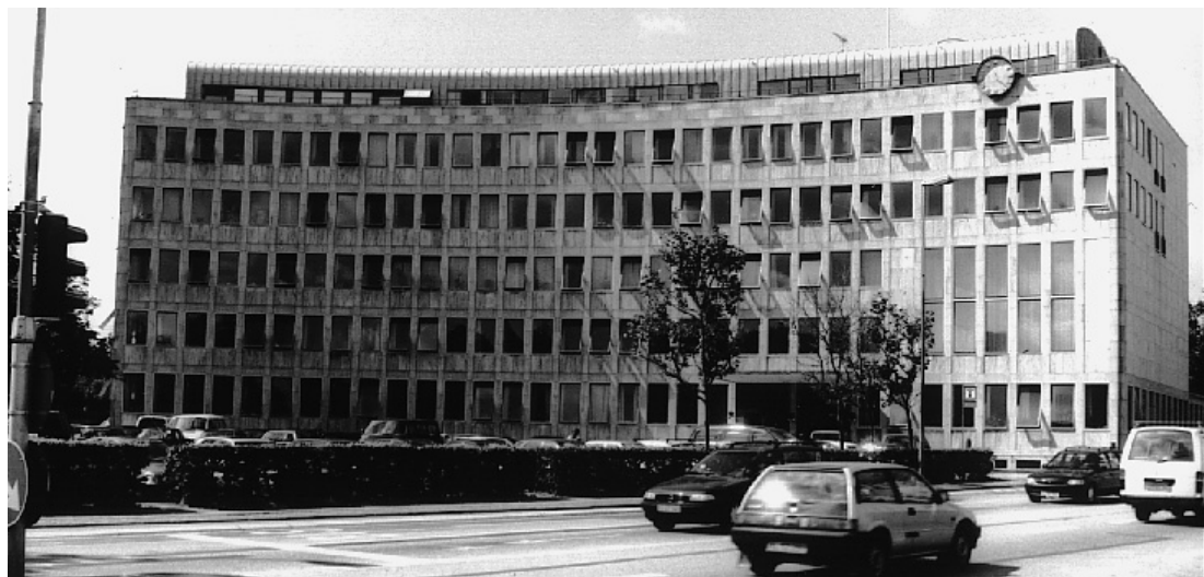
Lyngby-Taarbæk rådhus, 1941

munale administration er spredt ud over hele byen (som for eksempel i Kalundborg), har jeg valgt at lade kommunen repræsentere via den bygning, der huser centraladministrationen, borgmesteren og kommunaldirektørens kontorer, samt, så vidt muligt, byrådsalen. Med andre ord: den kommunale administrations hjerte.