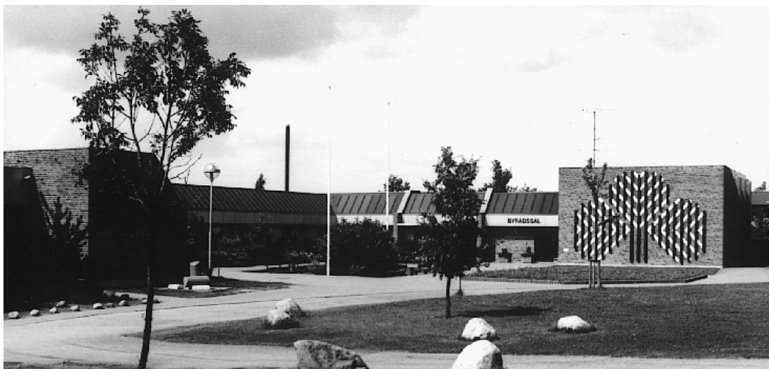
Ledøje-Smørum rådhus, 1980

byggede man fortrinsvis på frie grundarealer i de mindre byers udkant, mens man i købstæderne søgte at lade administrationen forblive i centrum.