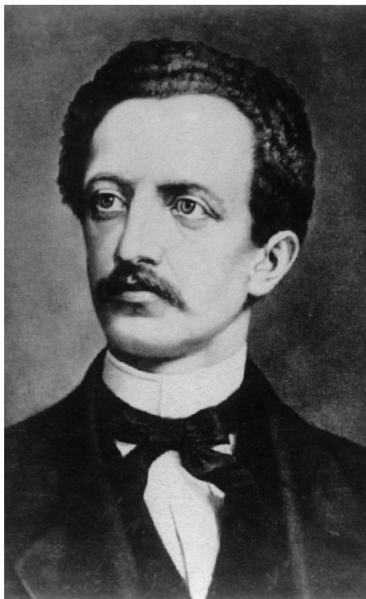
Ferdinand Lassalle (1825-64). Grundlægger af den tyske arbejderbevægelse i 1863. Døde i 1864 i en duel med en adelsmand. Lærte Marx at kende under revolutionen i 1848, men udviklede siden nogle idéer, som Marx lagde voldsom afstand til.

Lassalles statsopfattelse var ovenud positiv. Staten var det forum, hvor menneskeslægten udvikling hen imod frihed skulle fuldbyrdes, hvor individerne var samlet til et etisk hele: "Statens Formaal er... ved Forening af alles samlede Kræfter at sætte den enkelte i Stand til at naa op til et saa højt Stade i Tilværelsen, som han aldrig vilde kunne naa ved egen Kraft. — Altsaa, det er Statens formaal at bidrage til, at alle kan opnaa den Sum af Dannelsen, Oplysning, Magt og Frihed, som umuligt vilde kunne naas af hver enkelt alene. Statens Formaal er altsaa at føre det menneskelige Individ frem til positiv Udfoldelse og fremadskridende Udvikling, med andre Ord at forme og højne den menneskelige Kultur saa vidt det er muligt, og at føre Mennesket