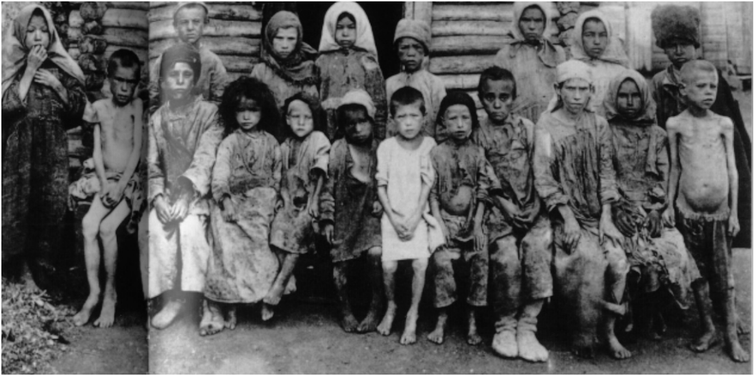
Børn under hungersnøden i Volga-regionen 1921-22.