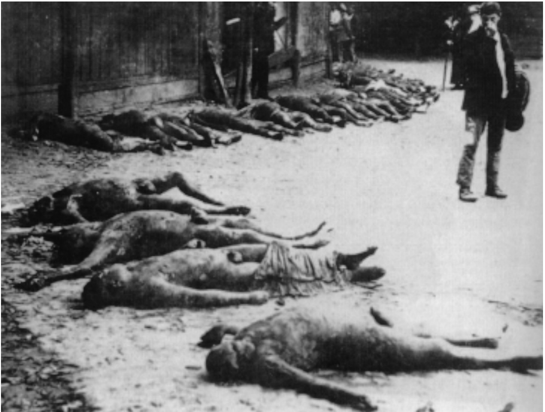
Ofre for Tjekaen ligger tilbage efter Den røde Hær har trukket sig tilbage fra Kiev i 1919.