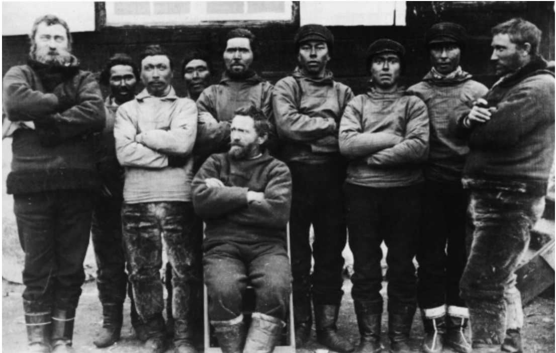
Kivfakkere ved Christianshåb i 1916.

Brugen af indfødte som fastansat arbejdskraft var noget, som specielt handelens købmænd i Grønland i lang tid så med stor skepsis på. Mens fx Det almindelige Handelskompagnis ledelse i København var positiv overfor brugen af grønlandere og især de såkaldte blandinger , 4 da man derved kunne spare både lønudgifter og transport- og udsendelsesudgifter, så betvivlede flere af kolonidistrikternes handelsledere (betitlet købmænd og senere kolonibestyrere ) deres brugbarhed som stabil arbejdskraft. Generelt anførtes det af de