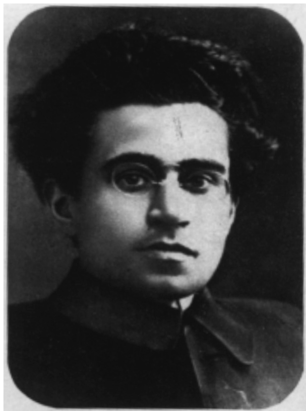
Antonio Gramsci (1891-1937)

institutioner, organisationer og foreninger. Som vi skal se har Laclau og Mouffes diskursteori en særlig værdi i denne forbindelse. En værdi der har været med til at promovere diskursteorien som både et intellektuelt og politisk alternativ til den marxistiske samfundsanalyse.