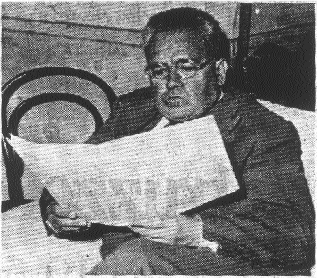
Forstørret fotokopi fra fotografi af Amadeo Bordiga, bragt i en italiensk avis i 1960. U.t., u.s.

Sovjetunionen sat under Internationalens administration, i stedet for som det hidtil havde været tilfældet, at bolsjevikkerne på Internationalens kongresser blot fremlagde, hvad de havde bedrevet og især, hvad de havde til hensigt at gøre. Efter 1926 ophørte Bordigas virksomhed for al fremtid som en i offentligheden kendt politiker, mens hans forfattervirksomhed synes at være gået i stå i de følgende 19 år, når man ser bort fra et større arbejde om marxismens økonomiske dele – forfattet i fangelejren og dermed pr. hukommelse – som blev til i 1929 som lærebog til de deporteredes