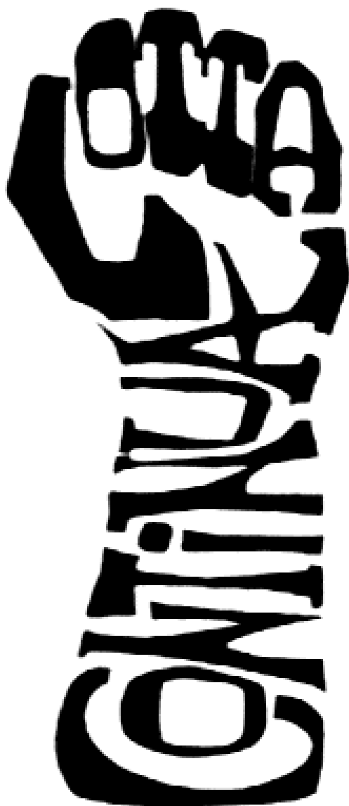
Udsnit af hovedet til tidsskriftet Lotta Continua .