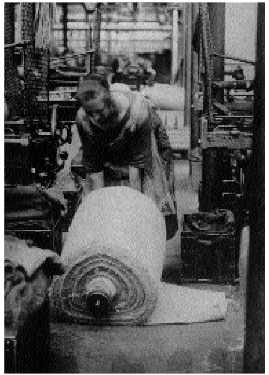
Kvindelige fabriksarbejdere i den tyske industri o. 1920

Men bagsiden af medaljen var, at ved at gøre kvinderne afhængig af staten, erstattede det lovgivningsmæssige beskyttelsesskjold de borgerrettigheder, som mange mænd efterhånden havde vænnet sig til. Under disse omstændigheder kunne de kvinder, som havde accepteret maternalismens grundlæggende tankegang (nemlig at manden burde tjene en løn, der kunne forsørge en familie, og at beskyttelseslovgivning mod for meget arbejde kunne beskytte kvinderne i eget hjem) dårligt insistere på også at have frihed på arbejdspladsen. Efterhånden som det 19. århundrede nærmede sig sin afslutning, begyndte et stigende antal middelklassekvinder at kæmpe for ligeret (ud fra en antagelse om, at kvinder kunne opnå økonomisk uafhængighed ved at fungere på stort set samme måde som mænd