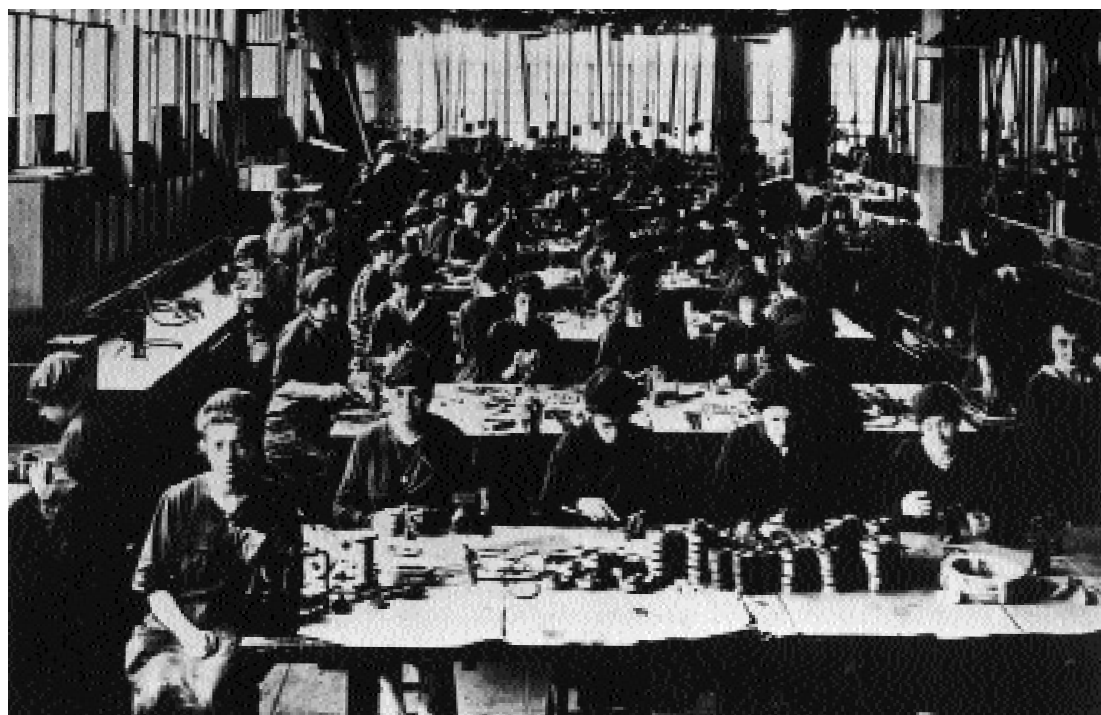
Kvindelige fabriksarbejdere på Fiat-fabrikkerne i Torino i starten af dette århundrede (ABA)