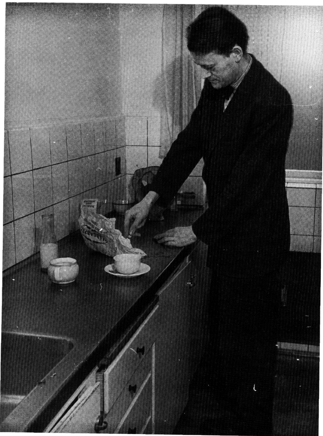
Jens Otto Krag var en af de cand.politter, der havde stor indflydelse på Socialdemokratiets kurs og strategi i efterkrigstiden. Her smører han sin mad i sit køkken på Frederiksberg (1947)