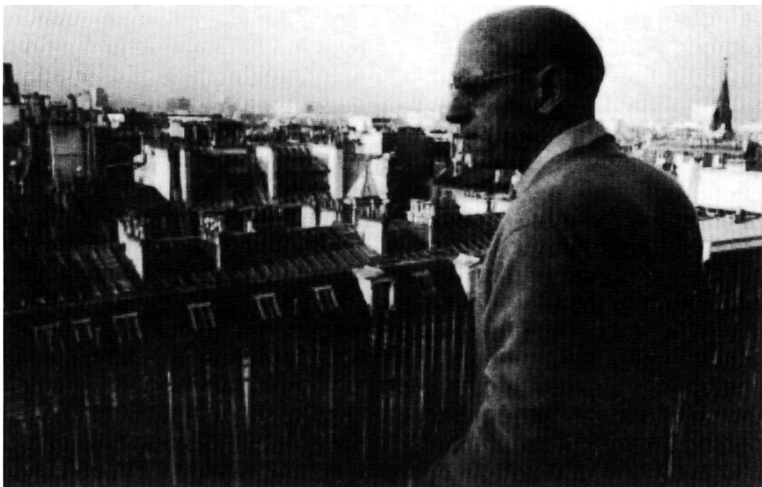
Den franske idéhistoriker Michel Foucault (1926-84).

Foucault bruger begrebet det moderne "episteme" for et udtrykke det samlede idékompleks, den magtform består af en særlig relation mellem viden og magt, der findes i videnskaberne om mennesket selv: Medicin, psykiatri, kriminologi, sociologi. Videnskaber, der placerer det moderne menneske i den dobbeltrolle, at det på en gang er subjekt og objekt for magt 13 . Og her er humanvidenskaberne ligesom psykologien en effektiv måde at integrere kroppene i de moderne magt-videnstrukturer, og deres fundament er grundlæggende set moralsk 14 .