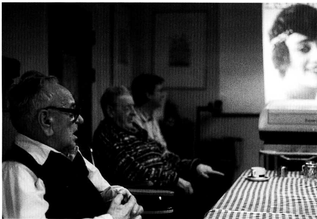
Erindringsaktivitet blandt mandlige beboere på Sct. Joseph Plejehjem i København.

"Meget andet taler for brugen af reminiscens . For mennesker, som er meget lidt aktive i nuet, kan fortiden give det mest levende samtalemønne, og derfor fungere, som et fortræffeligt fokus på sociale aktiviteter med andre mennesker i alle aldre. En af de stærke sider ved reminiscens er, at det kan anvendes som omdrejningspunkt for en række lystbetonede aktiviteter, fra klar regelret socialisering til det at skrive, male, spille musik, optræde og modtage/ give undervisning. Udflugter og praktiske aktiviteter som madlavning, havearbejde, rengøring og spisning kan stimulere og blive stimuleret af erindringer. Fælles aktiviteter på tværs af generationer og social baggrund kan have reminiscens både som udgangspunkt og resultat." 7