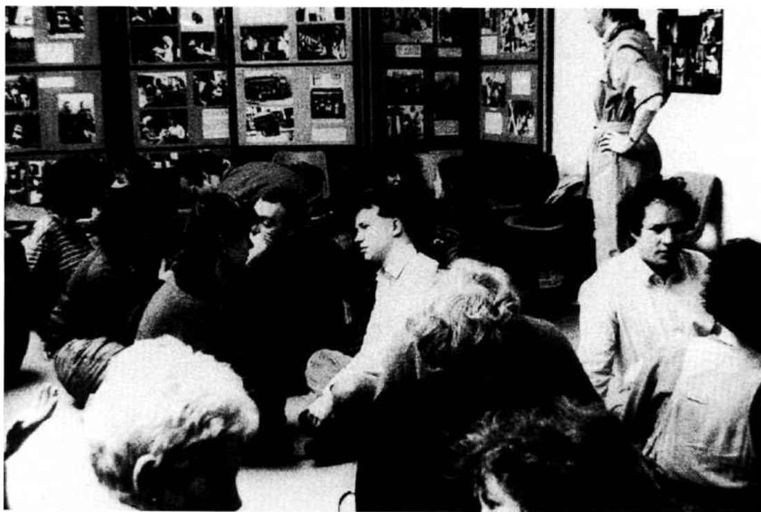
Kursusvirksomhed i reminiscens-metoden, som Age Exchange afholder for en lang række personalegrupper.