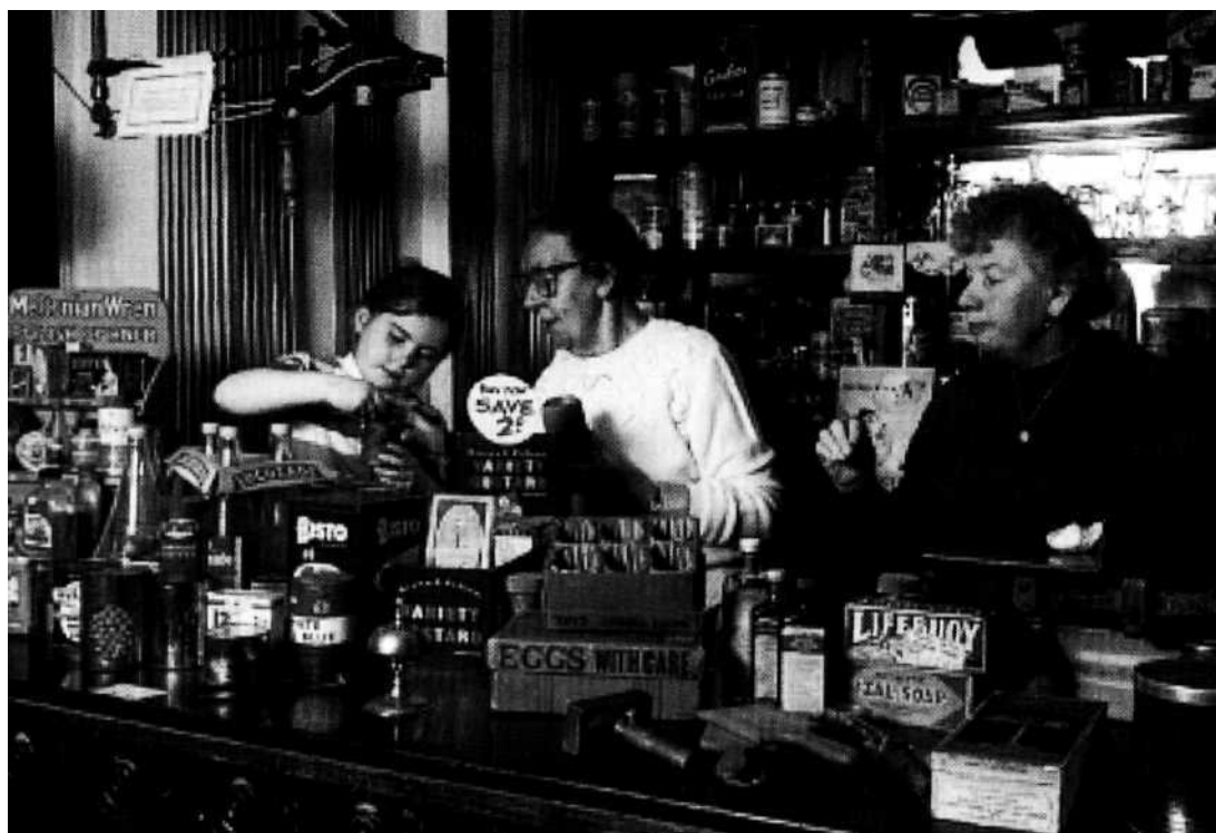
Frivillige medarbejdere i Age Exchange 's "hands-on " museum i London.