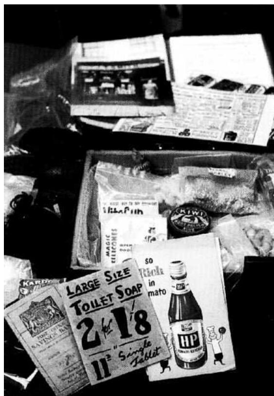
Erindringskasse fra Age Exchange om indkøb før i tiden