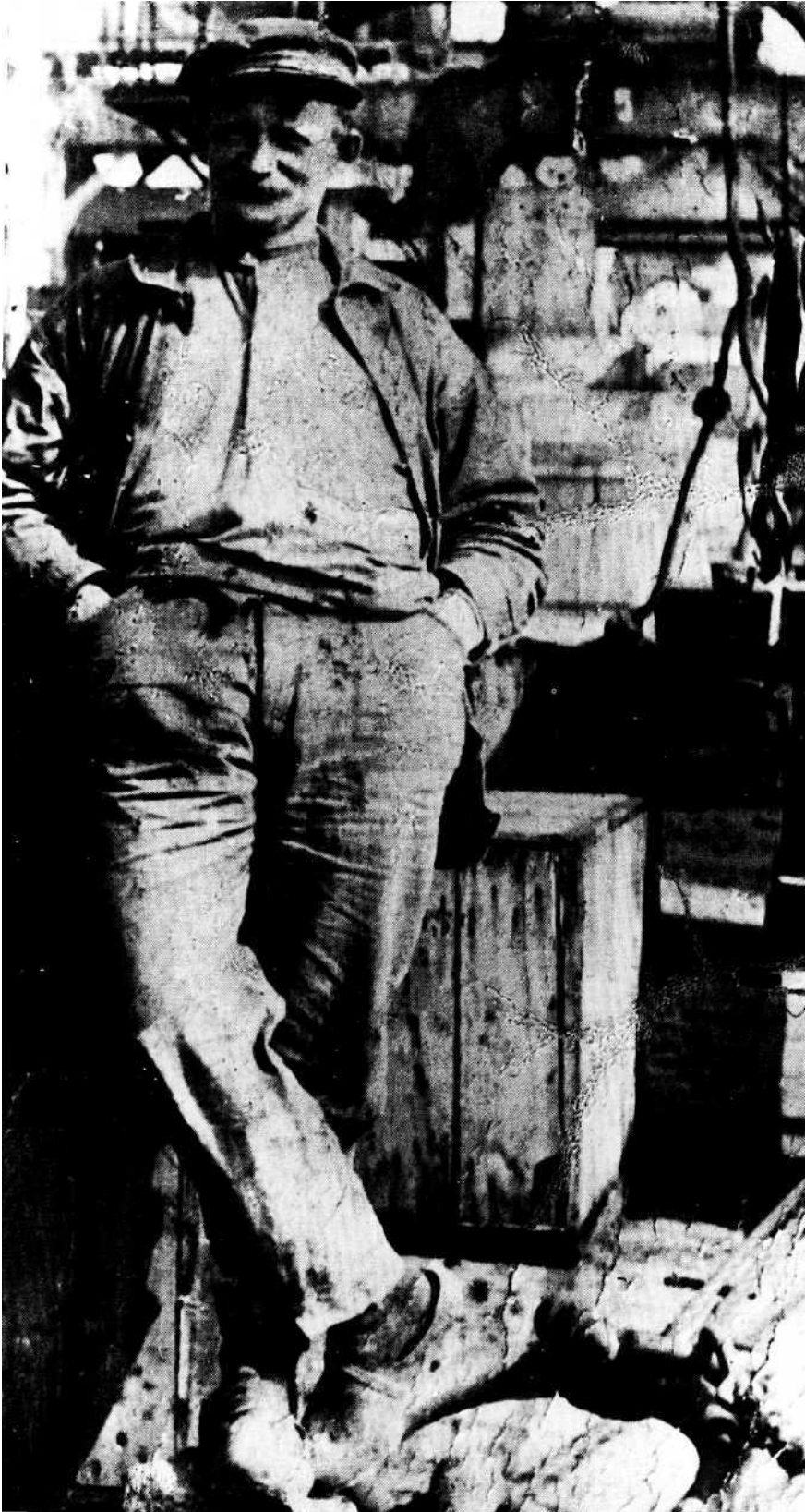
"Luftskipperen" i Københavns Frihavn ca. 1910. Øgenavnet kom af, at manden var faldet ned i lasten uden at komme noget til.