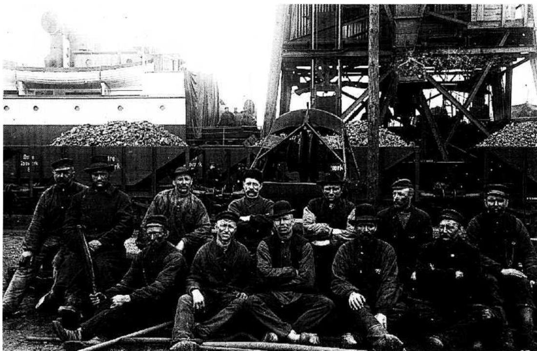
Havnearbejdere ved kulkranen i Tuborg Havn 1919.

Uroen i havnen i det tidlige forår var efter alt at dømme begrundet i kravet om højere løn; men den almindelige strejke i maj havde "til formål fjernelsen fra havnen af arbejdere, der for 6 år siden under en arbejdsstandsning lod sig ansætte som arbejdere i havnen". 60