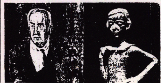
En af de danske Grandt i Berlin.