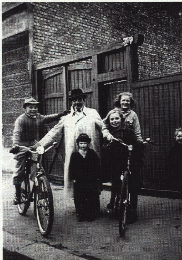
Stykkelen er en utpreget »erindringsgjenstand«. Bildet er tatt en gang i 1930-årene utenfor Nordrehovsgaten 30 på Kampen.

Betydningen av ting – empirisk som symbolsk – kommer godt fram i erindringsbilder fra ungdomsårene. Dette er en livsfase hvor ungdom i arbeiderklassen begynte å tjene sine egne penger, penger som dels gikk til familiens hushold, dels til personlig forbruk (Thorsen 1993). Ungdomstiden er også en periode hvor gutter og jenter ble mer bevisst om hvordan status ble signalisert gjennom det materielle, i det private så vel som i det offentlige rom. Klær er det mest nærliggende eksempel på gjenstander som de aller fleste husker og som har en klar symbolfunk-