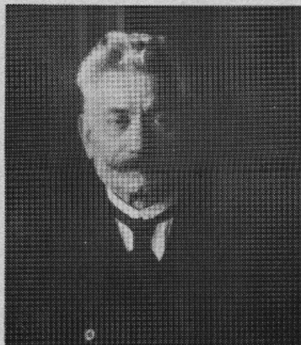
Karl Legien (1861–1920)

Man kan således konstatere, at de tilstedeværende faglige ledere på konferencen i København er blevet enige om at holde kontakten ved lige, at fortsætte forhandlingerne under lignende former som i 1901 – dette fremgår foruden af Legiens rundskrivelse også af det samtidige referat i Social-Demokraten – samt at udvide forhandlingerne til også at omfatte andre landsorganisationer end de i København repræsenterede.