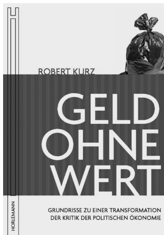
Geldkrise ohne Wert. Forsiden på en af Kurz sidste udgivelse, udgivet i 2012.

Værdikritikken er et forsøg på at komme ud over en sådan forståelse af de kapitalistiske fænomener: "Den første vanskelighed for en kategorial kritik af kapitalismen består altså i at fravriste disse kategorier deres status af stum selvfølgelighed, gøre dem eksplicite og derved overhovedet mulige at