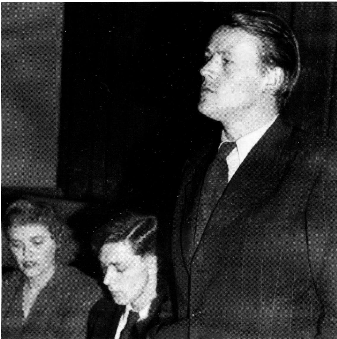
Chefarkitekten bag Fremtidens Danmark, Jens Otto Krag på talerstolen den 1. december 1946 i DsU i Vejle. Bag på billedet har Krag skrevet: "Jeg staar paa samme maade paa en talerstol i dag".

Erhvervslivet, planlægge Produktionen i visse koncentrerede Industrier, fastsætte Maksimalpriser e.l. At betegne en saadan Fremgangsmaade som S. er dog at gøre Socialiseringsbe- grebet ganske udflydende, — den tyske Beteg- nelse Planwirtschaft (Planøkonomi) er her langt mere træffende". (Salmonsens Konver- sationsleksikon, Kbh. 1926). 2