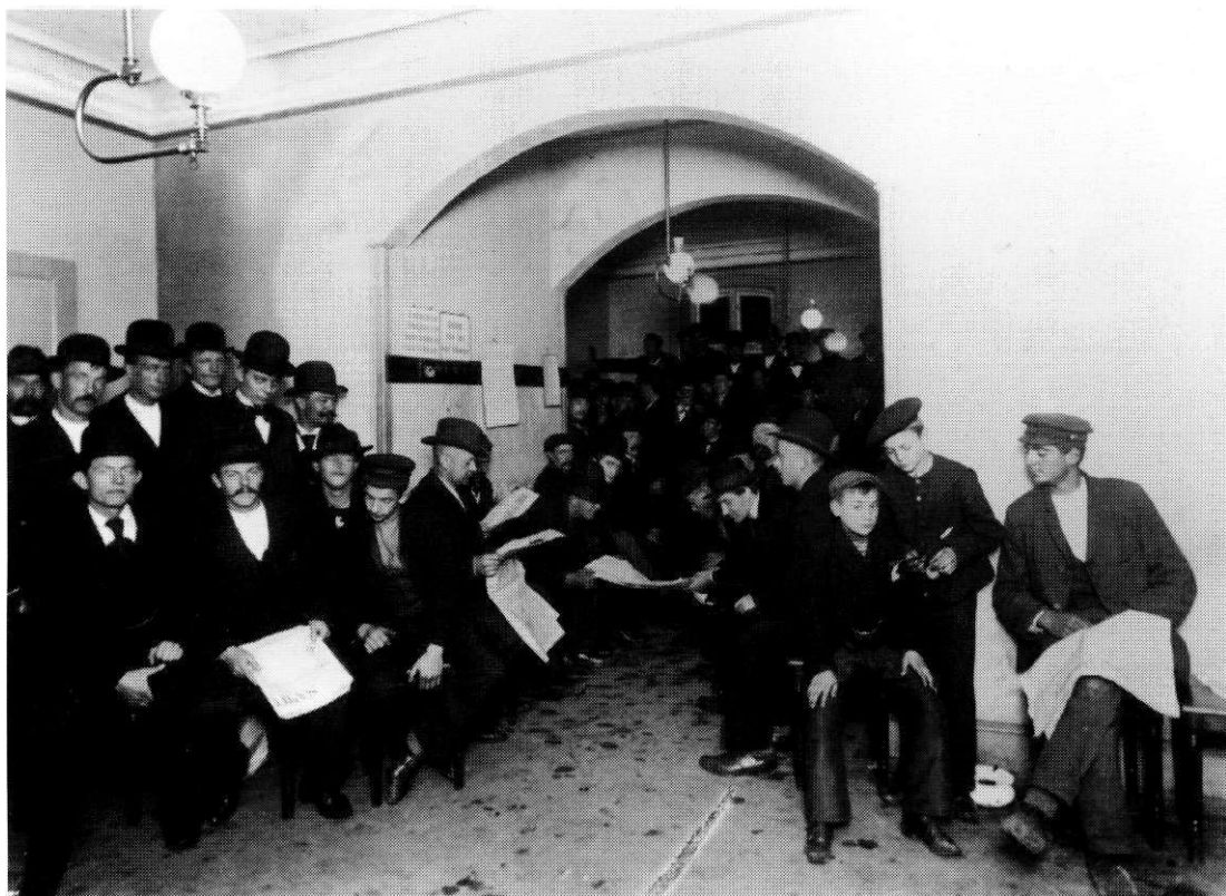
Arbejdsanvisningskontor ca. 1904. Der er formentlig tale om Københavns kommunes arbejdsanvisning i Guldbergsgade. På væggen kan man læse, at "Uindskrevne Arbejdsløgere bedes forsyne sig med 1 Nummer", men også at "Enhver maa kun tage 1 Nummer" (ABA).

borgerskabet, der tænkte fremadrettet - på den institutionaliserede klassekamps præmisser.