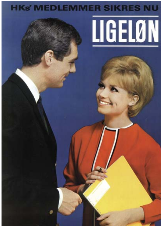
Ligeløn blev indskrevet i HK's overenskomst i 1963, men trådte først i kraft i praksis to år senere.