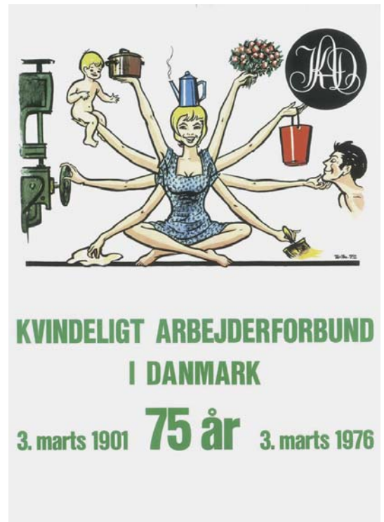
Kvindeligt Arbejderforbunds plakat fra 1972 fandt genklang hos samtidens kvinder. Den blev genbrugt med farver til jubilæet i 1976. (W.M.)