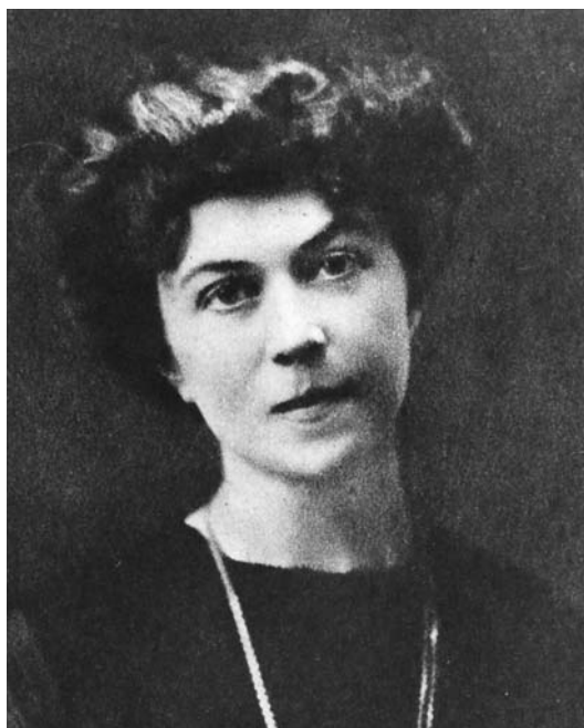
Alexandra Kollontaj (1872-1952) russisk socialist, forfatter og agitator, repræsenterede de russiske arbejderkvinder på kvindekongressen i København. Hun var fra 1908-17 i eksil i bl.a. Tyskland, hvor hun arbejdede tæt sammen med Clara Zetkin. Alexandra Kollontaj holdt taler flere gange i København og begejstrede både publikum og presse.