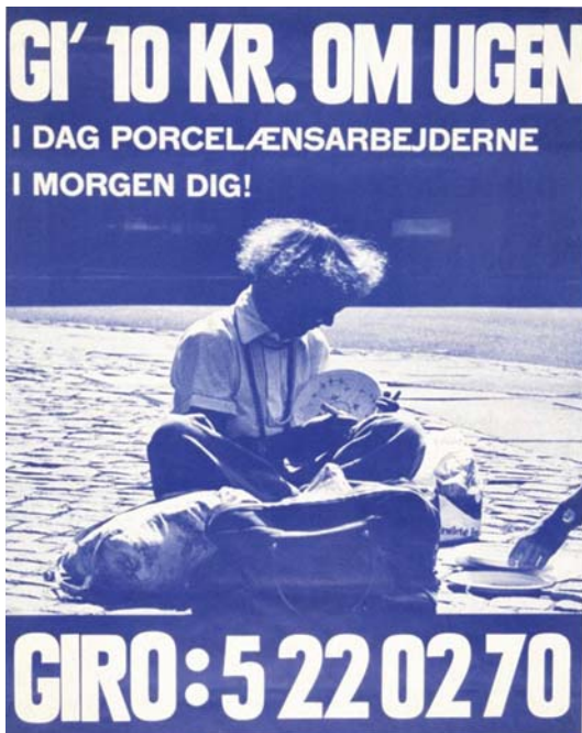
En konflikt i 1976 på Den kgl. Porcelænsfabrik fik stor opmærksomhed og sympati fra offentligheden. Bedst kendt blev "plattepigernes" håndmalede paptallerkener. I virkeligheden var det en lavtlønskamp for en langt større gruppe ansatte.