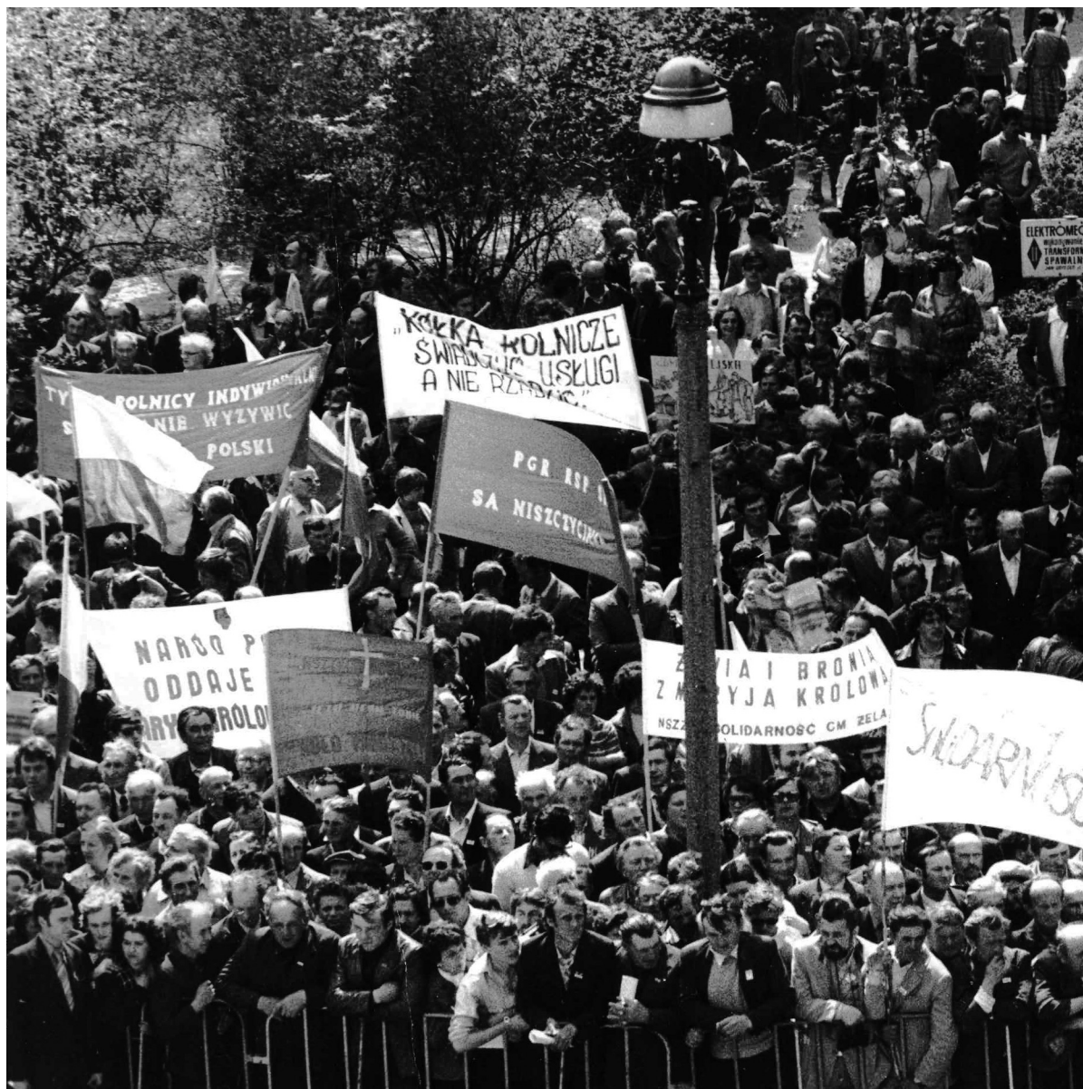
Demonstrationer i Gdansk for Solidarnosc i 1981.

som følge af præsident Jimmy Carters menneskerettighedspolitik. Her over for fremhævede han fordelene ved den danske regerings såkaldt stille diplomati. 59 I samme periode kritiserede LO ved flere lejligheder skarpt repressive tiltag i østlandene. Intet af dette skabte nogen LO-S konflikt, hvilket ikke mindst skyldtes en arbejdsdeling, hvor LO i princippet koncentrerede sig om internationale fag-