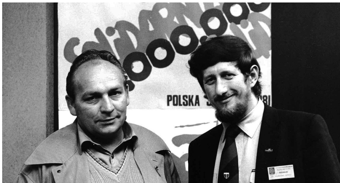
2 repræsentanter fra Solidarnosc til kongres i 1981.